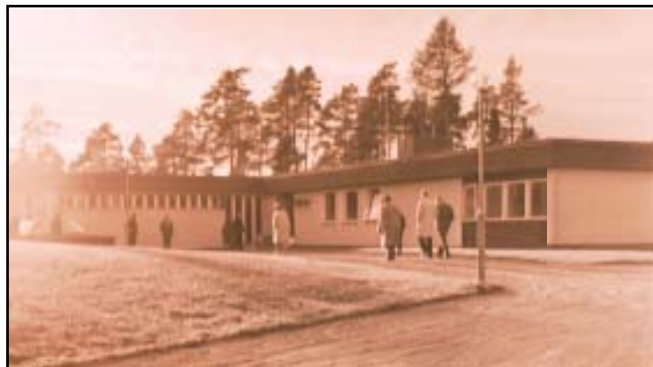
Märsta ålderdomshem klart för invigning 1965