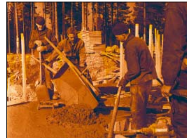
Grundläggning Arhem 18/3 1964