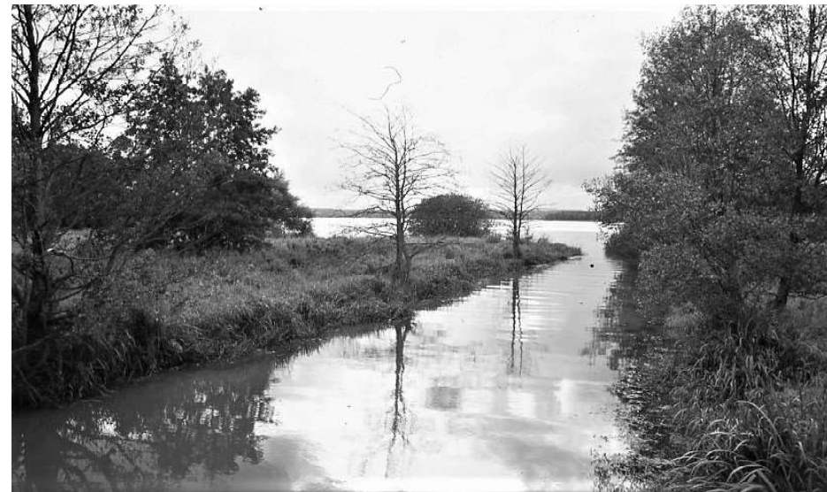
Märstaån är riktigt vattenfylld när den rinner ut i Steningeviken.

Mina ungdoms vintrar var riktiga vintrar som jag minns. Skidor och skridskor var vanlig utrustning. Vissa år frös ån till i Steningedalen så att det gick att åka skridskor hjälpligt. Vad man lärde sig var att inte åka där de talrika bäckarna rann ut i ån och där isen var tunnare. Man lärde sig den hårda vägen. Det var lång väg att genomblöt gå hem. Mitt liv som framtida skidåkare blev heller inte som jag hoppades. En av mina träningsrundor jag åkte var längs ån ner genom Steningedalen. Jag kämpade på gan-