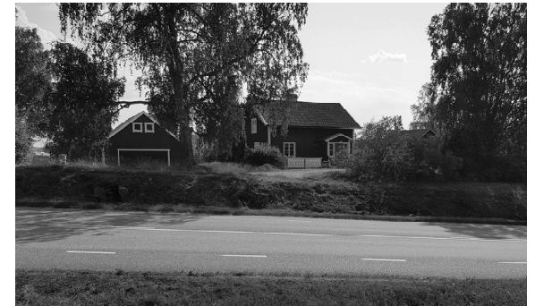
Krogtorp en varm dag i mitten av juli 2021.

E 4 hette tidigare huvudriksväg 13 fram till 1962. Motorvägen mellan Märsta och Uppsala blev klar 1972 och därmed byter E 4 sträckning. Sedan kallas vägen länsväg 255.