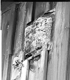
Getingboet sitter på hussidan på bilden ovan