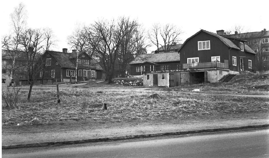
Nymärsta gård som den såg ut på 1950-talet.

Runt omkring dominerar betydligt större fastigheter. Där finns de färgglada husen på Södergatan och biblioteket och kulturskolan. Men också 50-tals husen på både Stockholmsvägen och Skolgatan.