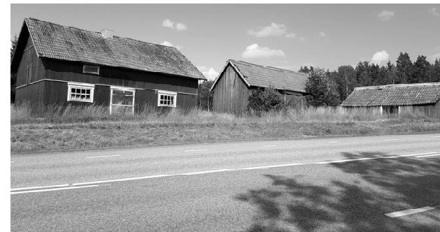
Uthusen på andra sidan av vägen