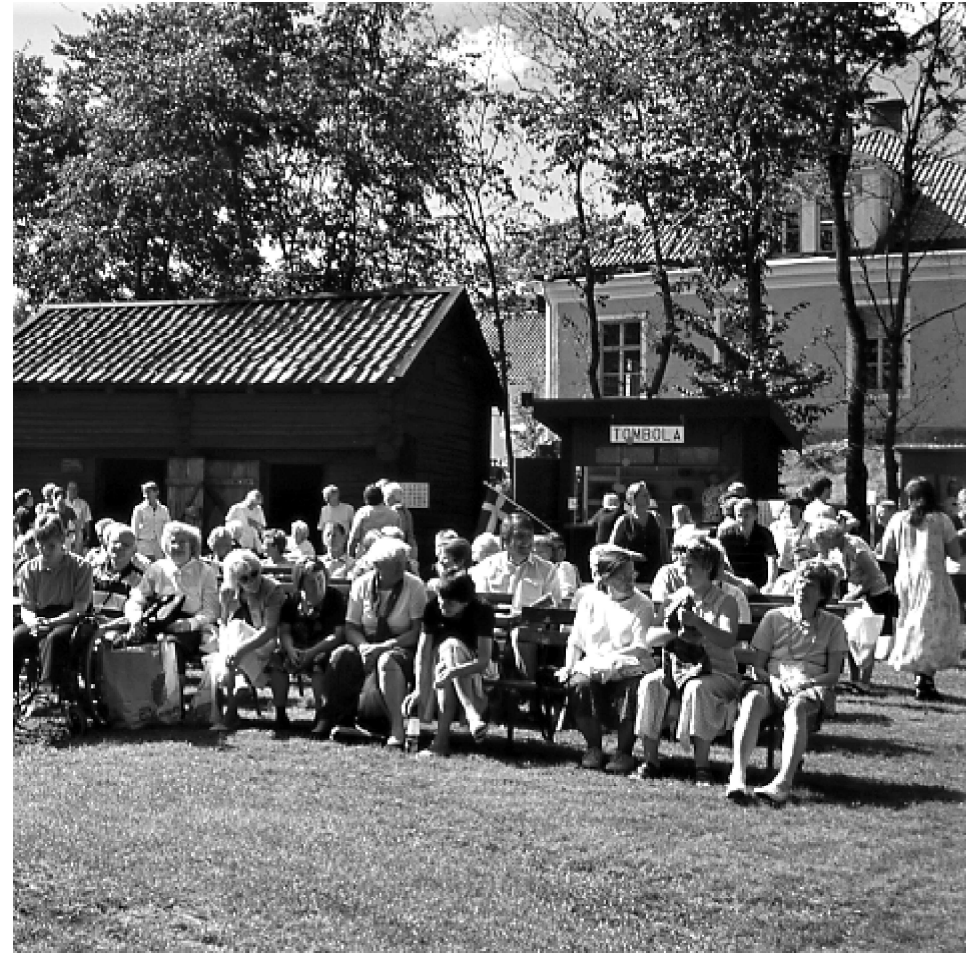
Hembygdens dag 22 augusti