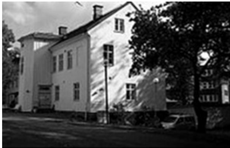
Spinnhuset i Göteborg.