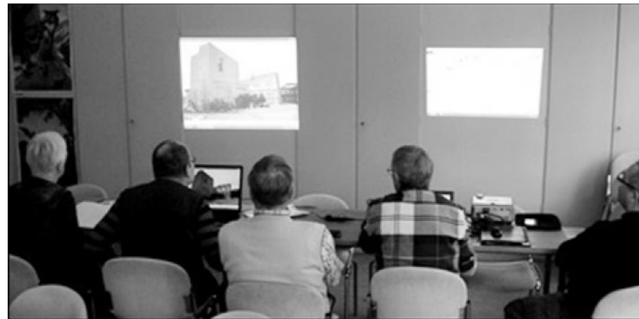
Här använder fotogruppen skolans väggdörrar för bildvisning. När de arbetar vänder man fotografen ryggen.