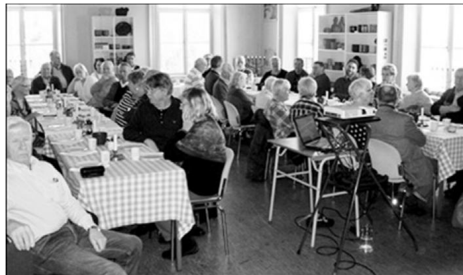
Nu har en del av publiken kommit och fler lär det bli.

Numera finns en förening som heter "Södergatans vänner" som till den 23 maj planerar en folkfest längs gatan med bilkortage och flera andra aktiviteter.