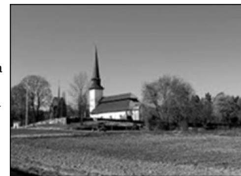
Ringkarleby kyrka