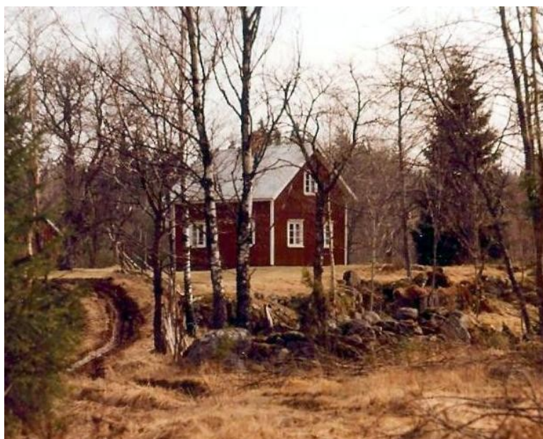
Gammalt foto, Vasen.

Det sägs att namnet Vasen kommer av den genväg som gjordes mellan Holskaryd och detta torp. Det var väldigt surt i backen upp mot torpet så man lade riskärvar "vasar" i dyn, som sedan trampades ner så att marken blev bärande och farbar.