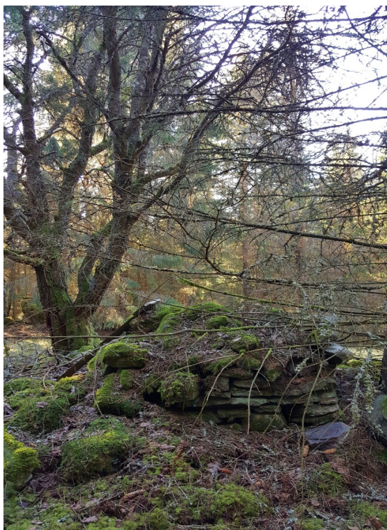
Stuggrunden med spismur.