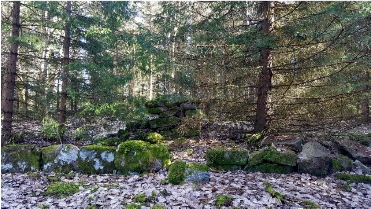
Husgrund och jordkällare på Södra Ållebacken.