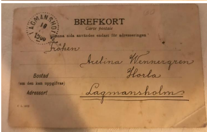
Hols skola på ett brevkort från år 1900