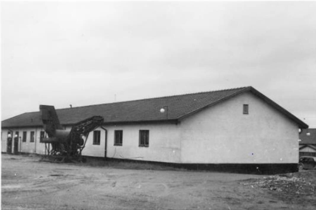
Vägstation p10 torp

Vi börjar med några bilder från 40-50 talet