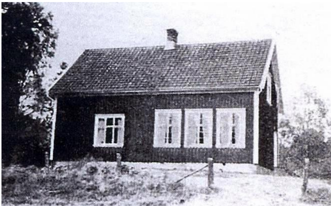
Bild 2. Oryd 1 2 , Kärtared, Alingsås: 500 meter från busshållplats. Areal: 1.234 kvm. Taxeringsvärde 6.500 kronor, därav mark 500, byggnad 6.000. Förvärvat 1949. Fastigheten av trä, uppförd 1923, innehållande 3 rum, 1 kök. — Fd lantbrukare Gottfrid och Selma Johansson; barn: Linnea, Dagny.