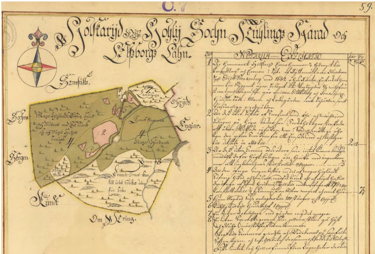
Karta från 1718, reviderad 1733.

Går ej att få fram exakta årtal när kvarnen var i bruk men den fanns före 1718 och efter 1878. På platsen finns grundstenar och några gamla kvarnstenar.