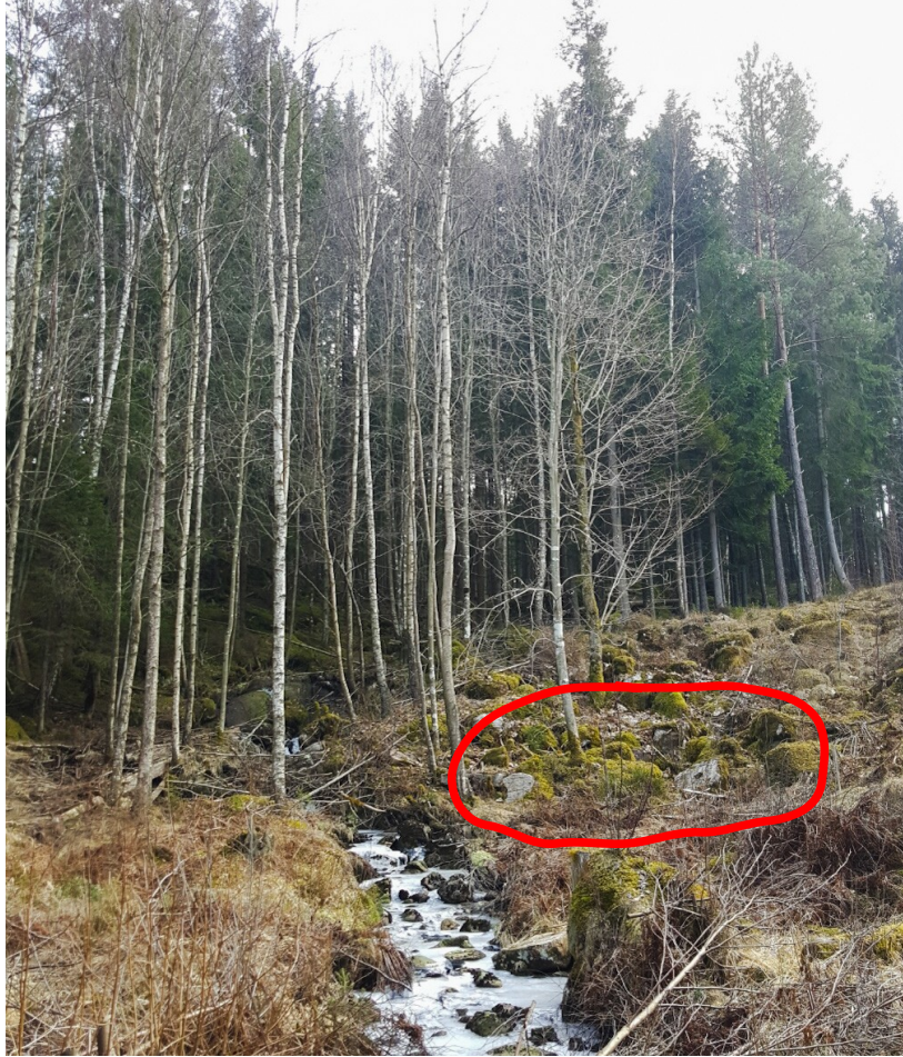
Mycket gamla kvarnstenar