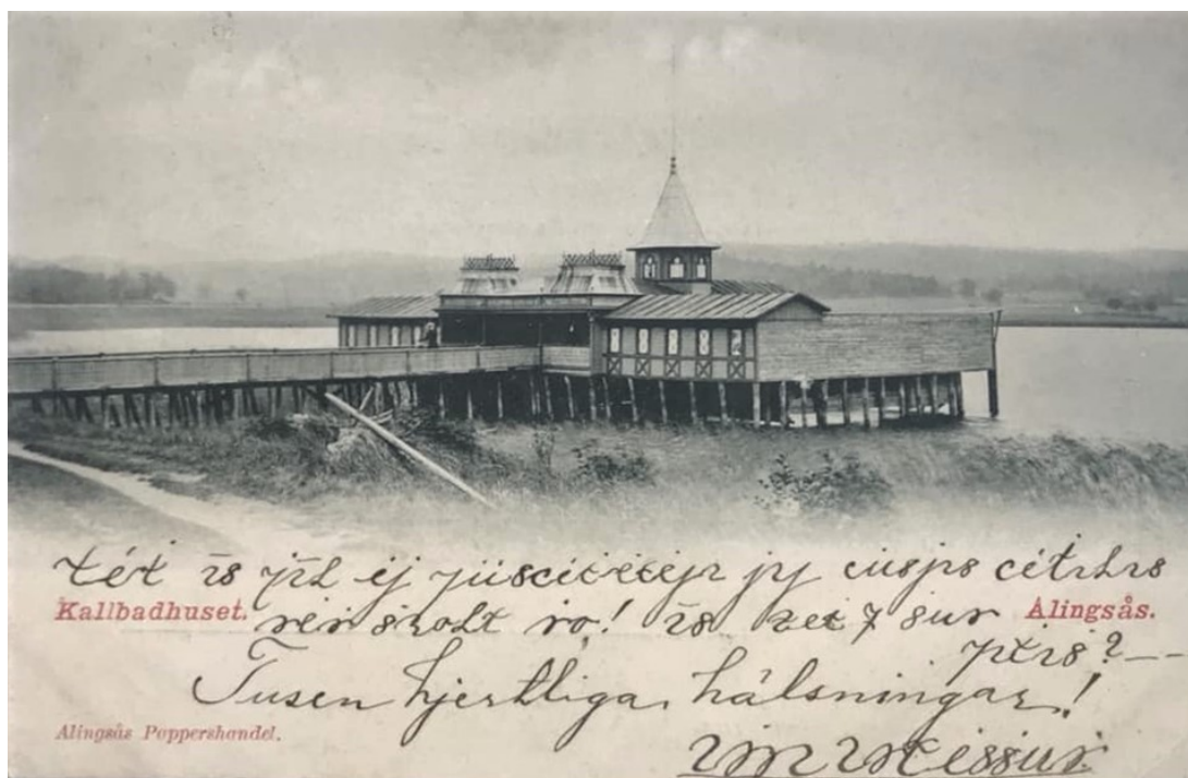
Kallbadhuset i Gerdsken. Vykort skickat 1908