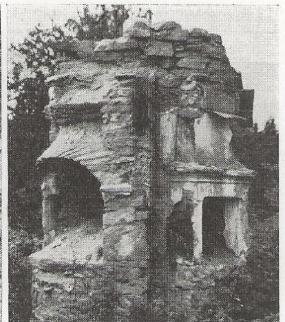
Ett par bilder från f. d. torpet Bergsjöhöj