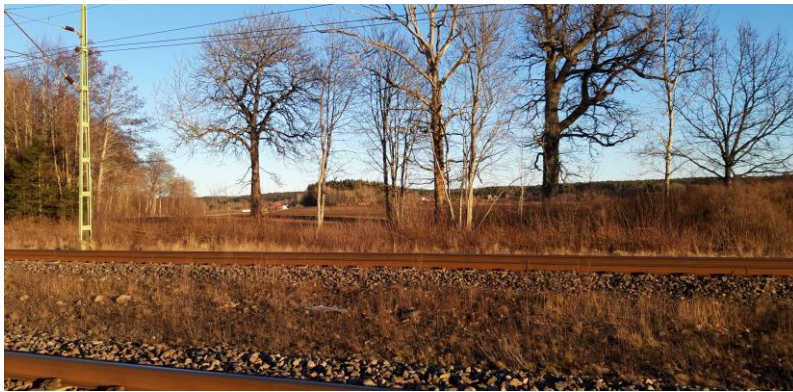
Så här ser det ut på platsen idag 2021