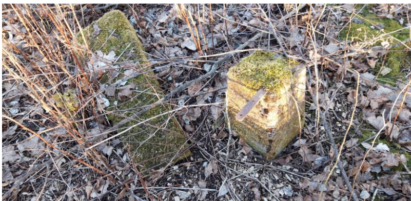
Hittade bara ett par stenar som visar att något funnits på platsen.