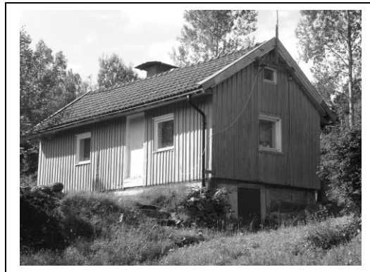
Huset på Högekulle.