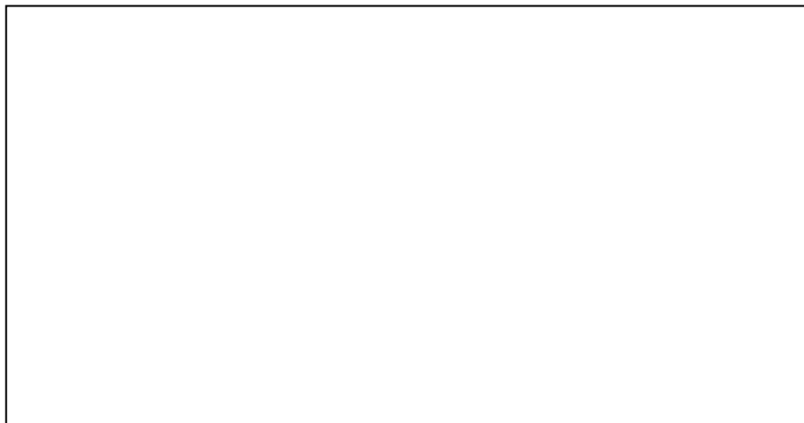
Huset på Ettermaden.

Familjen är hitflyttad 1793 från torpet Aspelund under Karstorp, Bälänge.