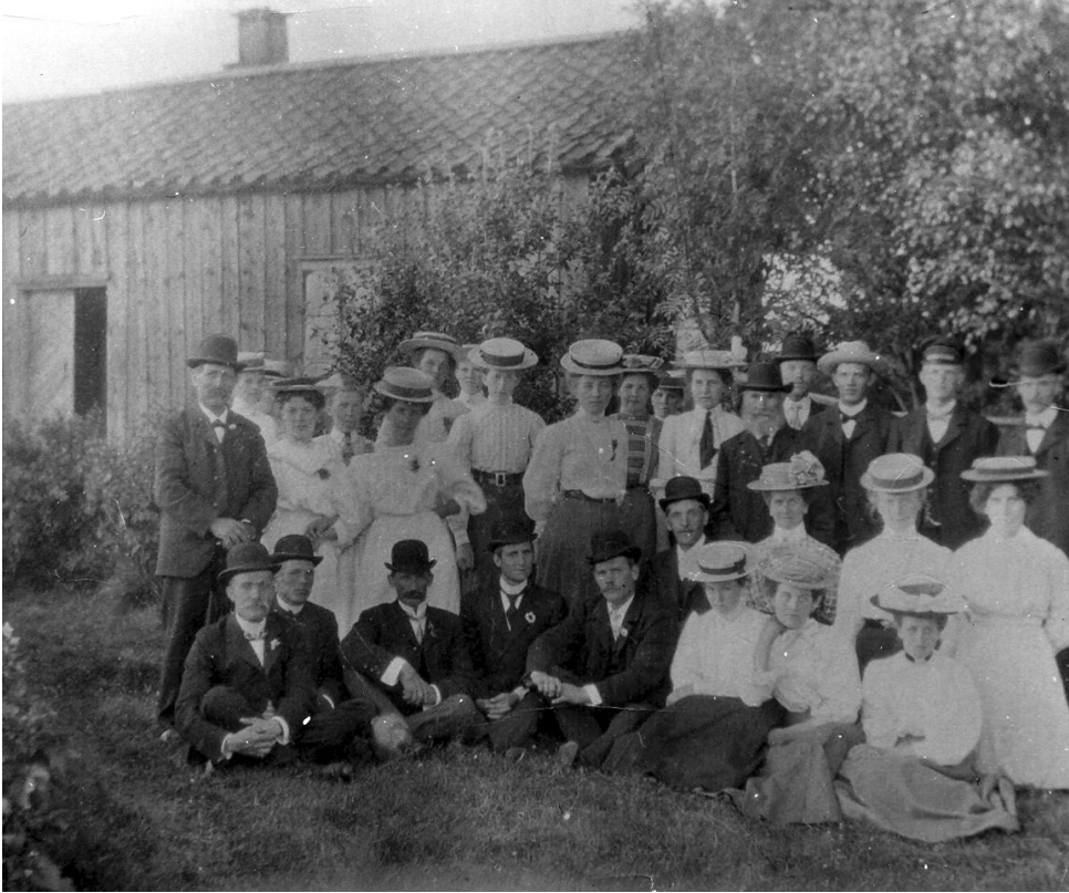
En ungdomssamling på Brantatorpet, omkring 1910.

14, 18, 19, 26, 13, 15, 16, 17, 20, 21, 22, 23, 24, 25, 27, 28, 29. 4, 9, 10, 11, 12.