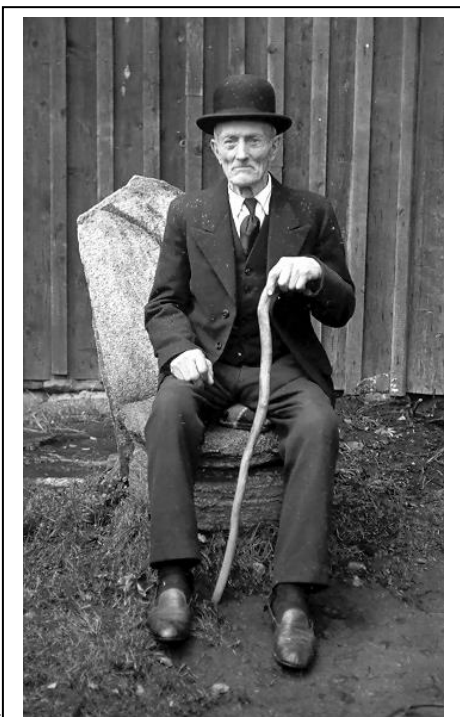
Iv 8. Ivar kallade sej senare Andersson.