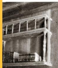
ett fanns en tavlett