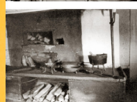
Skulpturen. På bilden ser vi en skulptur av Bergsmanshemman som ligger i ett rum i gamla huset. På bilden ser vi ett rum i gamla huset som ligger i ett rum i gamla huset.