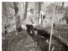
Schaktet med mot mansgröppan vid Ålsmöryttan.