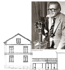
Förstag 18 augusti 1895. Fäsked med Storgatan.