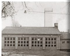
Nora brandstation 1943.