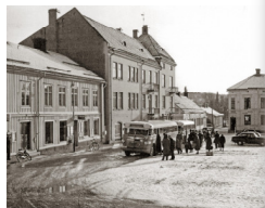
Nordenströmska huset, uppfört 1916