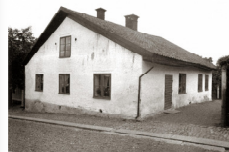
Kvarteret 1. Enligt vissa uppgifter skulle detta hus ha varit ett skolelevens 1731, och sålts till ena stadens ättling. Andra källor menar att det är från omkring 1800-1810.