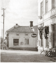
På Prästgatan 8 till Skoeffören Okarins Postens lokaler.