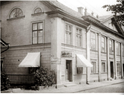
Prästgatan 6, gård nr 82, Wedbergsgården