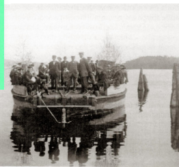
Prämen lastad med festfolk