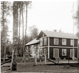
Orlenshuset i Dalkarlsberg