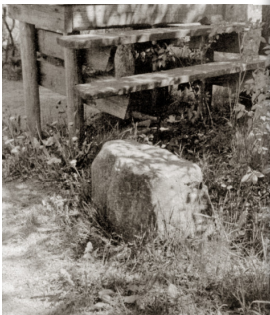
En fyrkantig sten användes som trappsteg då man ville stiga till häst.