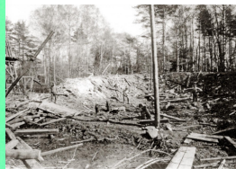
Sten har skett i Gyttorp