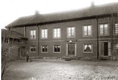
Gård 89-90, gårdens huvudbyggnad