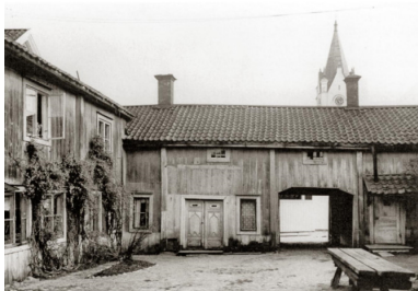
Sydöstra delen av Kihlbergsgården, Svartälvsgratan utanför porten