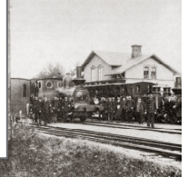
Stribergs Järnvägsstation på 1890-talet.