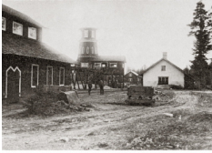
Östra Kärrgruvan i Striberg, 1800-talet.