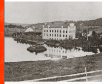
Orten. Fotografert af den nye masugnyaden var Hembyggsaget 1871.

Hembygdsföreningen Noraskogs skriftserie nr 7