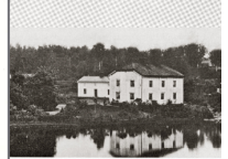
En ved den masugnyaden som erstatte ved den eldligt nye byggnaden. Fotografert på 1800-talet.