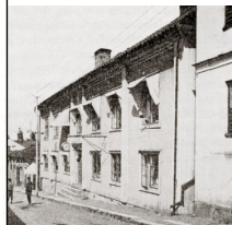
gamla huset vid Kungsgatan.