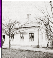
gamla sjukhus vid Ekshult.