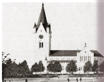
Den svävande helgedomen, invigt 1866