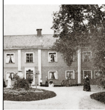
gården vid sekelskiftet.