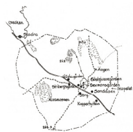
Plan åren 1863. Föreningsbyggnaden bakom till vänster. Bergände f. d. affär ligger till höger i bakgrunden.