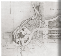
Plan över den gamla järnverkens byggnader. Den gamla järnverkens byggnader. Den gamla järnverkens byggnader.