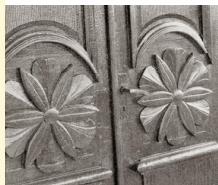
Ytterdörrar vid Svanungården.