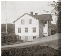
F. d. Berglunds affär.