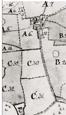
8 och 1799 visar Ålshov 1 med två mangröfverbyggnaden och värdelösa. Ålshov 2, "Östra Ålshov", sags långt ned på kartan.