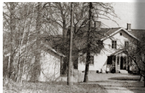
Nydriften 1900 visar den gamla mangröfverbyggnaden, tillräckligt 1700-tal. Trädgårdssten hade krigstiderna sedan.