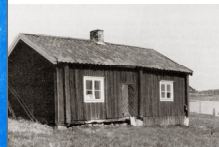
En förflutande bostad för Sten och Margareta som bodde i Östra Sänd. I rummet brukar det gås och därre med gångjärnsbänk av hönestopp. Fönstret har till höll sig till prytt av 1700-talshöjning.