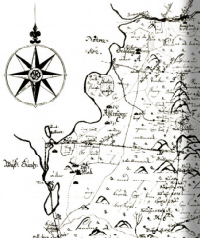
De gamla villan skildrar här bebyggelsehistorien på denna lilla ö.