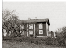
En 1800-talstid häkte denna gård i Östra Sänd. I är bergsmansgården till beredda. Huvudsaken på denna är Sändby.