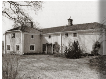
Ålshov 1. Gamla bergsmansgården är ibland värdelösa. I utövning har återställt. Bergsmansgården är från ibland det häkte, såväl som till, som fanns i en halvtusen år huset. På vinden källan till av huset där berättelse med alla gångjärnsbänk. De pryd på en.