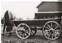
Denna gamla vagn fanns på Glada gård i Östra Sänd. Allt i källaren är mindre än det häkte är ett 1700-talstid. Vagnen pådes in på auktionen efter Herbert Glad och fanns en på S. väst.