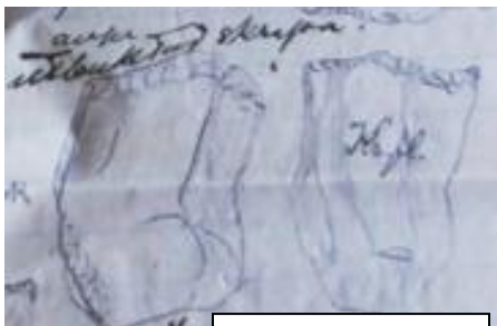
Skrapor av flinta