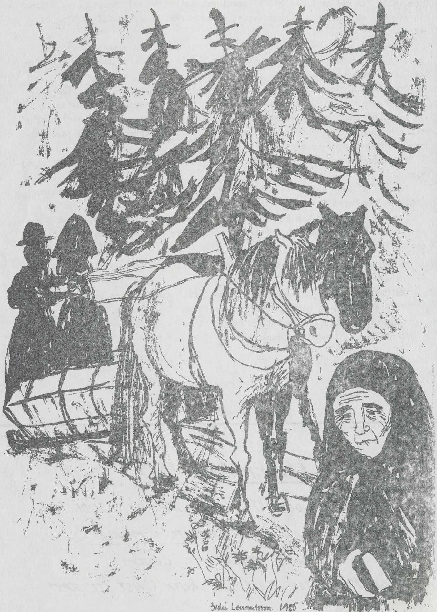
Bidu Lemaitre 1985