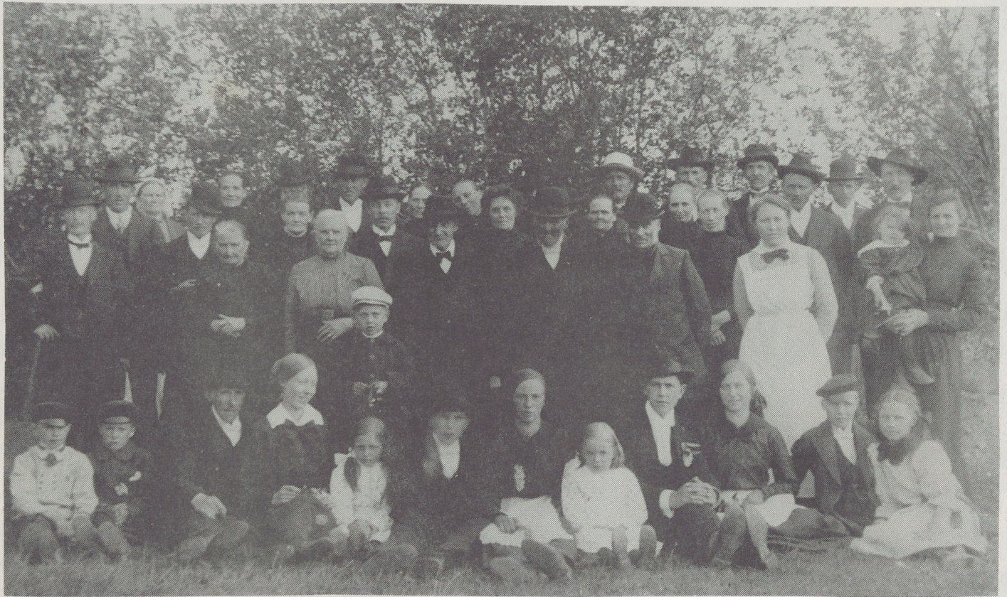
I ÖLBO - MAJ 1918

Medlemsblad från HEDESUNDA HEMBYGDSFÖRENING