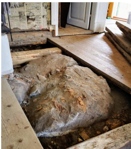
Det visade sig vara en stor sten som säkert vägde bortåt ett ton.

För ett antal år sedan gjorde en firma från Hälsingland en större reparation av torpet då bl a de undre timmerstockarna byttes. Redan då var det tydligen problem med stenen utan att firman sa något om det. I stället för att ge sig på stenen så karvade man ur golvbräderna på undersidan! Dessutom lade man in alldeles för få golvbjälkar med följd att golvet svajade trots att bräderna är rejält grova.