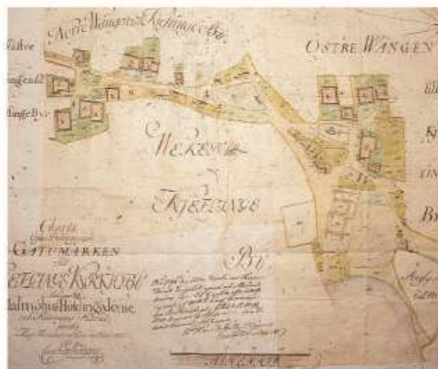
Översiktskarta över Kävlinge 1795. Mitt emot tingsplatsen nr 922 finns gästgiveriet med nr 919 och 920.

Med "min Sahl. Man" åsyftas här gästgivaren TRUED LARSSON, som drivit gästgive-