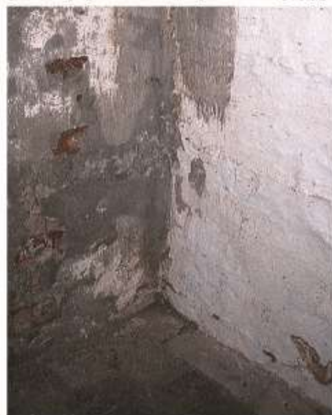
Den äldsta bevarade delen av den ursprungliga matkällaren, där mat och dryck kyldes.