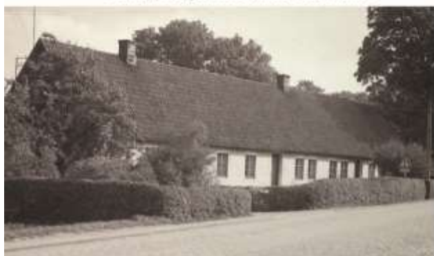
Kävlinge gamla gästgivargård vid landsvägen mot Lund. Foto från 1947. Teckning efter gamal förlaga med gästgiverilängan till höger.

farande kommer från Landskrona och Helsingborg, hantverkare kommer långt uppifrån landet på sin färd mot de stora marknadsplatserna i Lund. Kävlinge är en bra stoppunkt som ofta också utnyttjas av militär trupp vid förflyttningar. Vid denna strategiska plats kommer efter hand