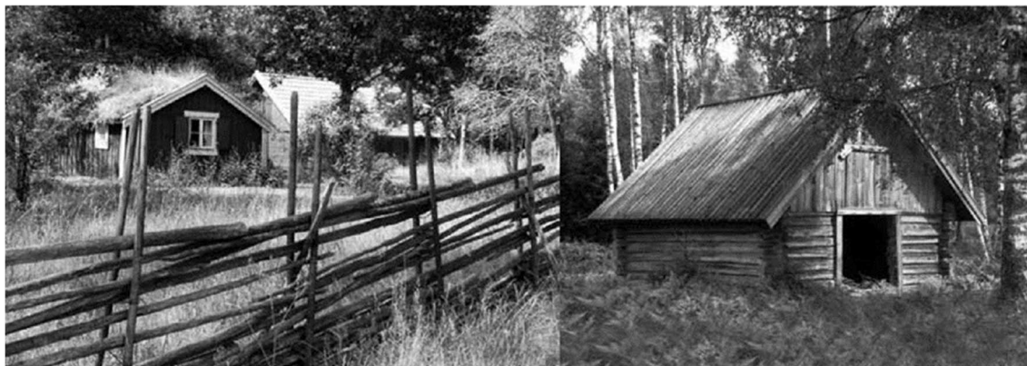
Mor Stavas stuga med Linds ladugård.

hur långt norrut man är och en annan siffergrupp talar om var man befinner sig i öst-väst. Det är ett antal satelliter som håller koll på exakt var vi befinner oss. Nu är det bara att skriva upp siffrorna. Nästa år när du vill besöka samma plats kanske skogen är avverkad och du känner inte igen dina hållpunkter i naturen. Knappa in dina siffror och följ apparatens anvisning och snart är du på rätt plats. Man kan snabbt och enkelt lägga in torpruiner, slaggvarpar, kolbottnar, tjärdalar, kvarnlämningar eller vad som önskas. Se artikel om soldattorpen vars lägen är noterade med hjälp av GPS.