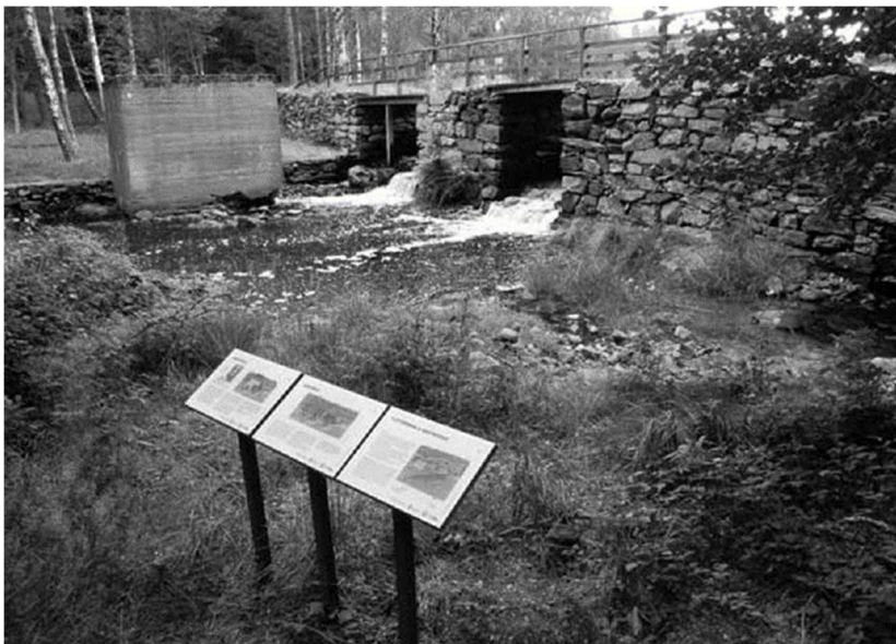
Dammvallen vid Barkeström. Den fyrkantiga betongkassunen till vänster är ett minne från tiden då det låg ett elkraftverk här.

Vårstädning runt alla våra hus i Basthagen och bland våra samlingar sker i maj.