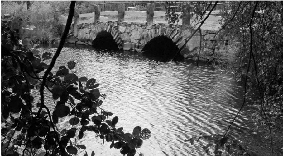
Valvbron vid Sjöabro vårdas av Hembygdsföreningen