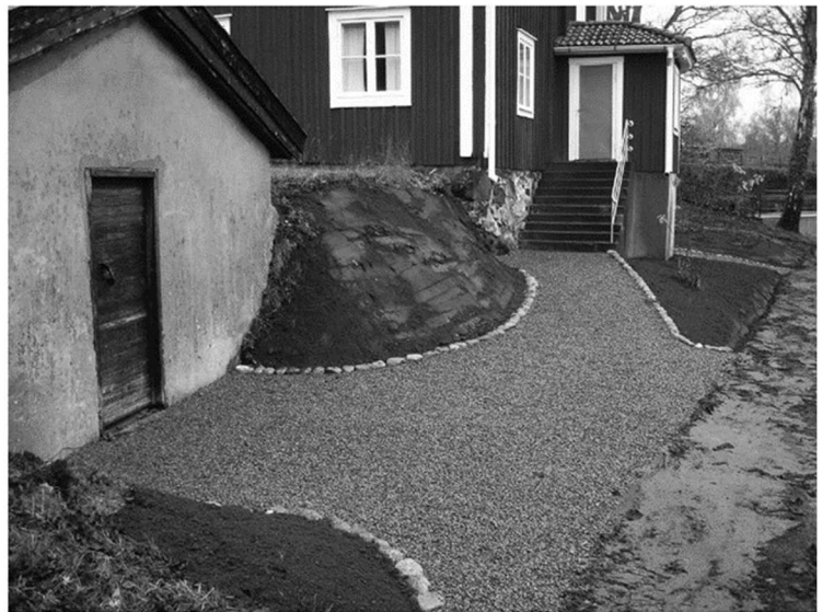
Hembygdsgården med återupprättade rabatter och grusgångar.