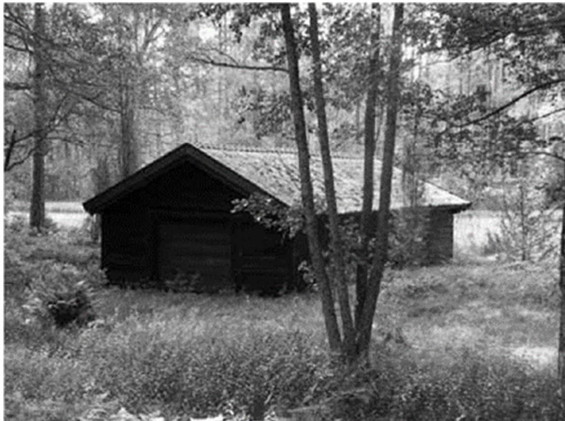
Linbasta som gett namn åt "Basthagen"