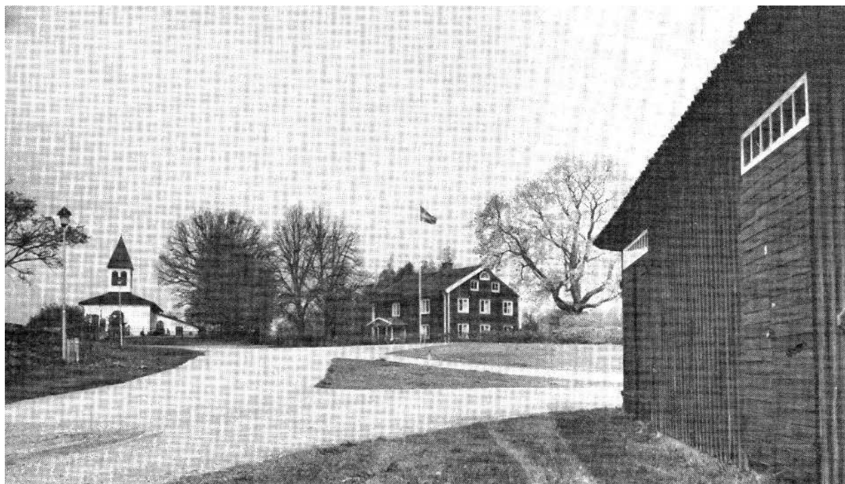
Hembygdsföreningens centrum: Kyrkan, stommen och kyrkstallarna