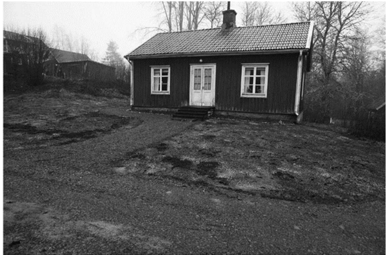
Mjölnarbostaden med återinlagd grusgång och nyröjd tomt.

Rabatter har åter tagits fram och planterats med tidstypiska blommor, en del blommor nyinköpta och en del hittade på området. Bärbuskar har planterats. Grusgångar har tagits fram och täckts med singel. Befintliga syrenbersåer har beskurits, för att de ska växa upp och bli täta och fina. Lindar och en vårdträdslönn har beskurits av en arborist. Gräsfrön har såtts.