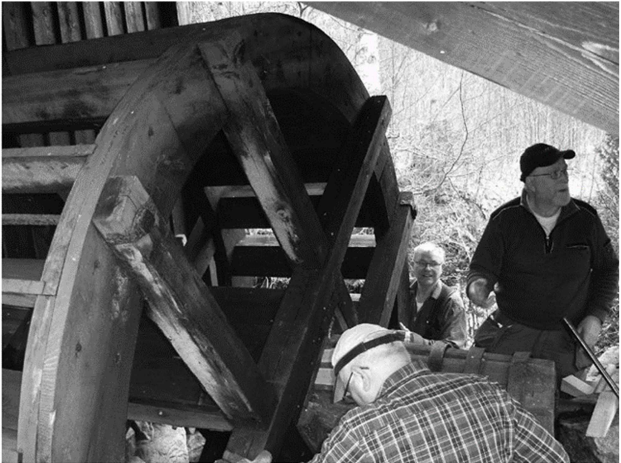
Reparationsarbete vid vattenhjulet till kvarnen i Åslahult.

Axeln till vattenhjulet har lagats och rännan har rensats från sten och gammalt ruttnat virke, så att kvarnen återigen kan mala. På utsidan av kvarnen tvättades alger och mögel bort.