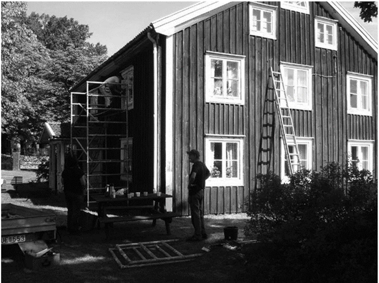
Målning i skuggan

Vi ansökte och fick pengar hos Håkanssonska fonden som förvaltas av Länsförbundet. Vi fick pengar till material, men inte några pengar till arbetet. Det var ett gediget arbete som genomfördes av ett antal mycket tappra och idoga medlemmar från början av juni till slutet av september 2018. Det här året var det dessutom en ovanligt solig och varm sommar, när alla dessa oräkneliga fönster, vindskivor, knutar och verandan skulle skrapas, tvättas, grundas och målas tillsammans med rödfärgning av väggarna.