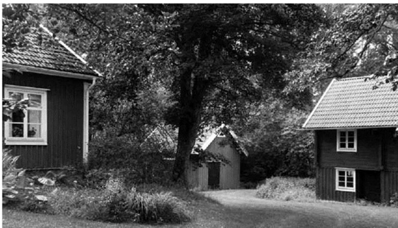
Till vänster skimtar kvarnstugan där mjölnaren bodde. Till höger syns kvarnen.

Biodlarna behövde någonstans att vara med sin förening. Kvarnstugan med omgivningarna fanns då som en resurs. I gott samförstånd kunde vi erbjuda kvarnstugan som klubblokal. Biodlarna sköter det akuta underhållet och klipper gräset. På hembygdsdagen ser de till att det finns nyslungad honung till salu.