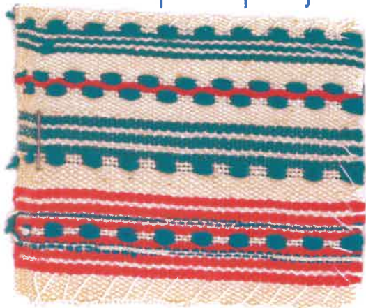
Förklädet från Tjärby.

↑ Vävt i tuskaft med ränder av en munka- bältesvariant.