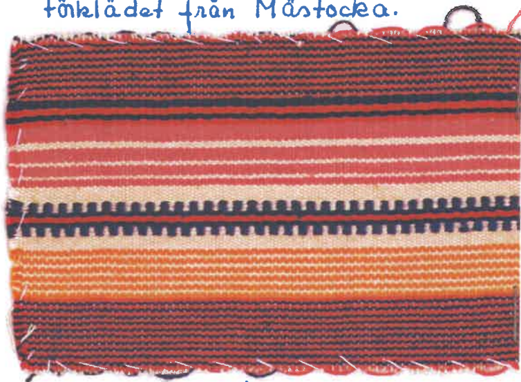
Förklädet från Mästocka.