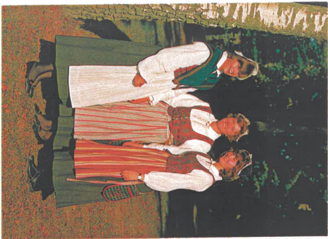
Veinges o. Nisslocka