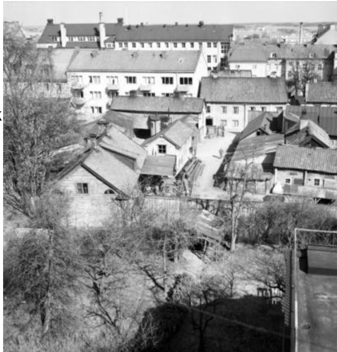
Vy över kvarteret Baggen med byggnader längs Klostergatan

I Jönköping stod trähusen tomma, gardinerna stängda bakom fönstren vars smuts var ingrott i glaset. Löven på träden hade precis trillat av grenarna och det var en kall eftermiddag i november 1834, men uppe i huvudstaden Stockholm, i den Kungliga Teatern, där var det mer liv. Det fanns en teatergrupp som hade diskussioner om att sprida finkultur till landsorten.