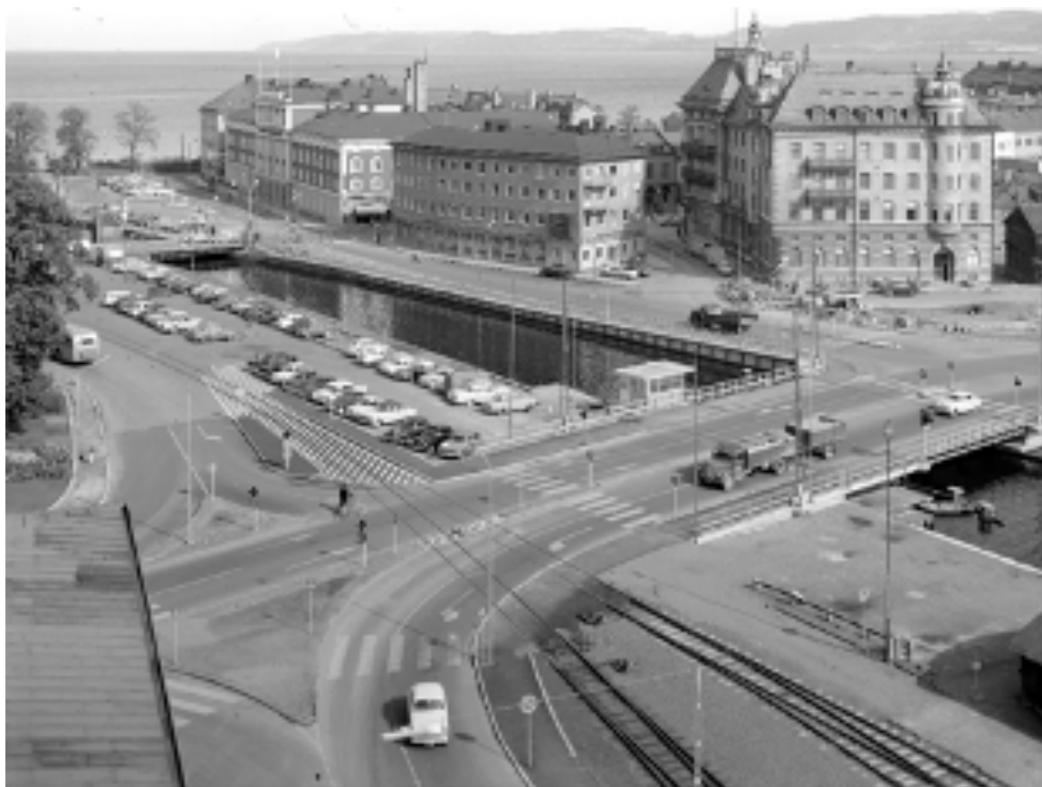
Bild 1 Bankhusen med nya bron i förgrunden

Runt Hoppets Torg fanns en tid tre bankpalats. Sparbankens hus, färdigställt 1901 och rivet, Smålandsbankens hus också byggt 1901 och kvar i allra högsta grad och Handelsbankens gula fasadtegelhus byggt 1943. Men de hus som vi idag betraktar som "ståtliga och snygga" har inte alltid varit väl sedda byggnadsverk.