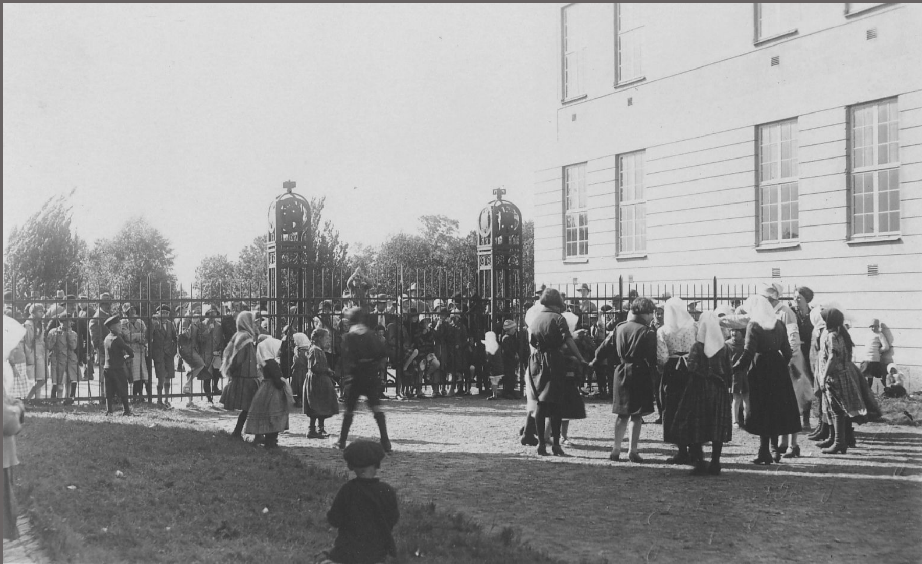
Nyfikna Jönköpingsbor beskådar barn från Gammelsvenskby som leker på kaserngården