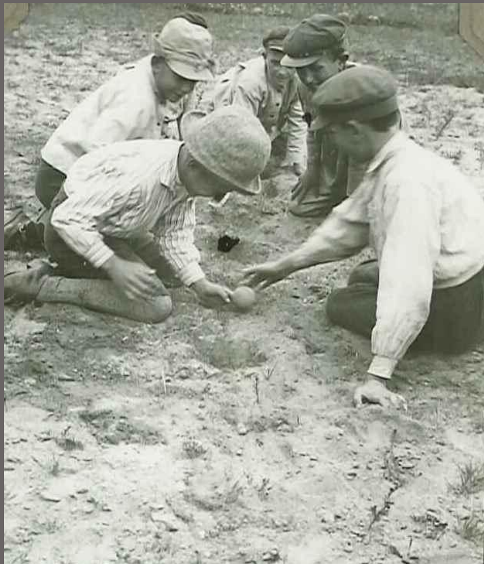
Grabarna sysselsätter sig med Leka Ägg