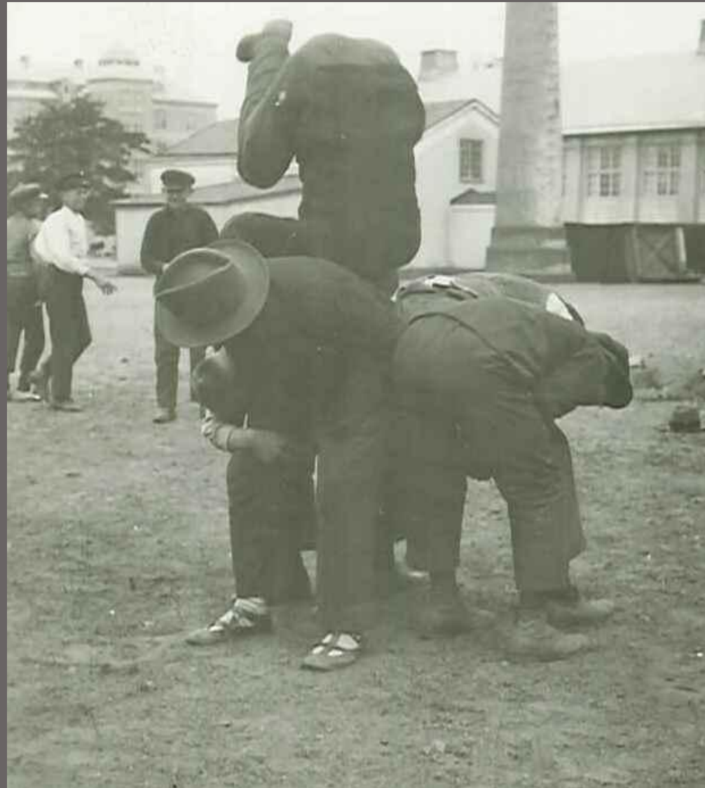
Här leker man "Verniholuva" översatt – Kasta över nacken. Fyra starka karlar agerar gymnastikplint, som sedan de yngre skall slå en kullerbytta över