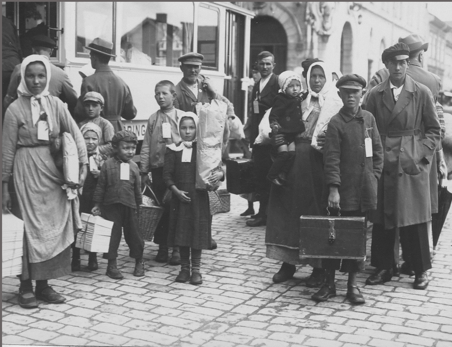
Alla nyanlända var försedda med en identitetslapp.