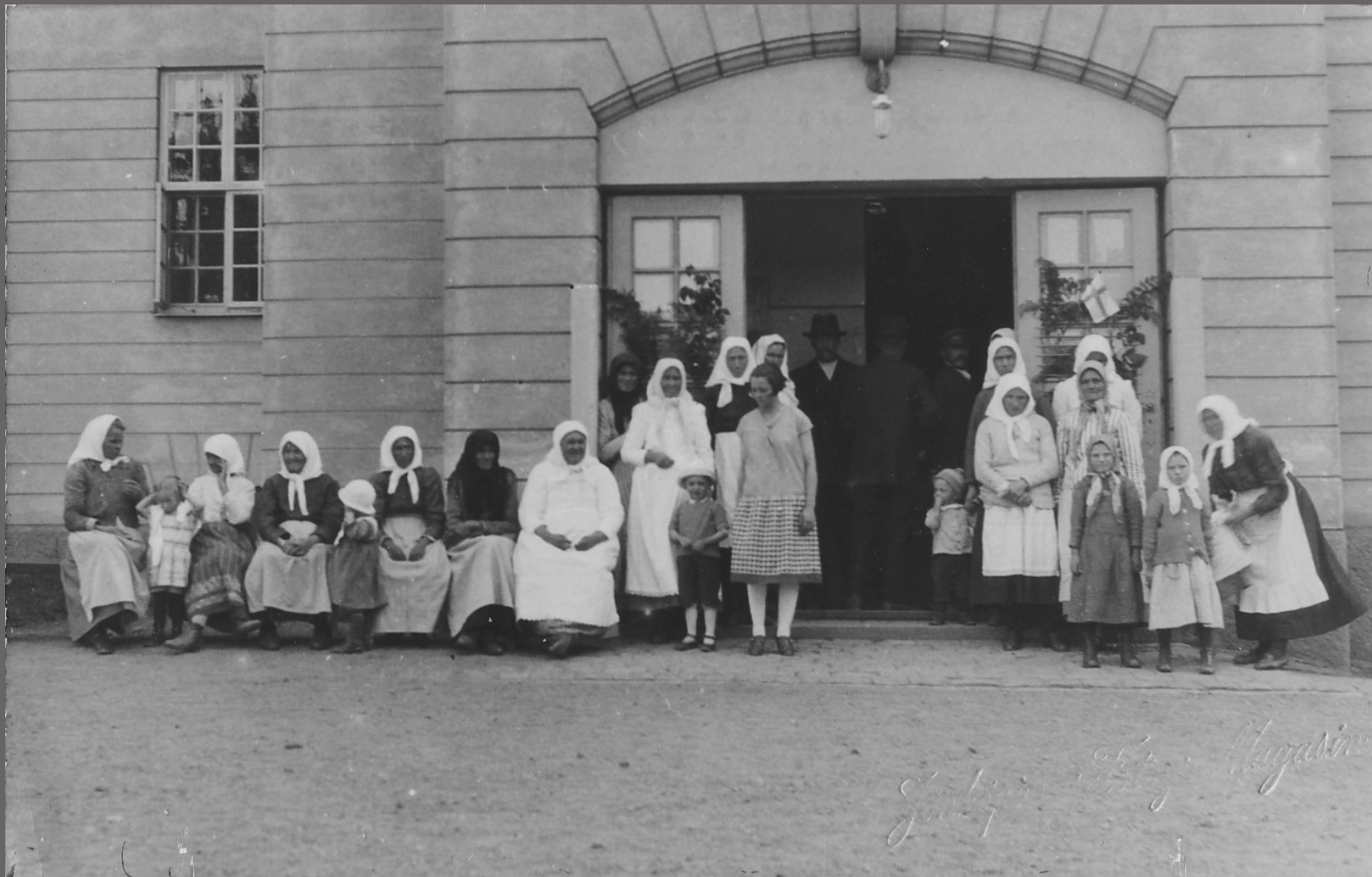
Uppställda utanför kaseringången för fotografering