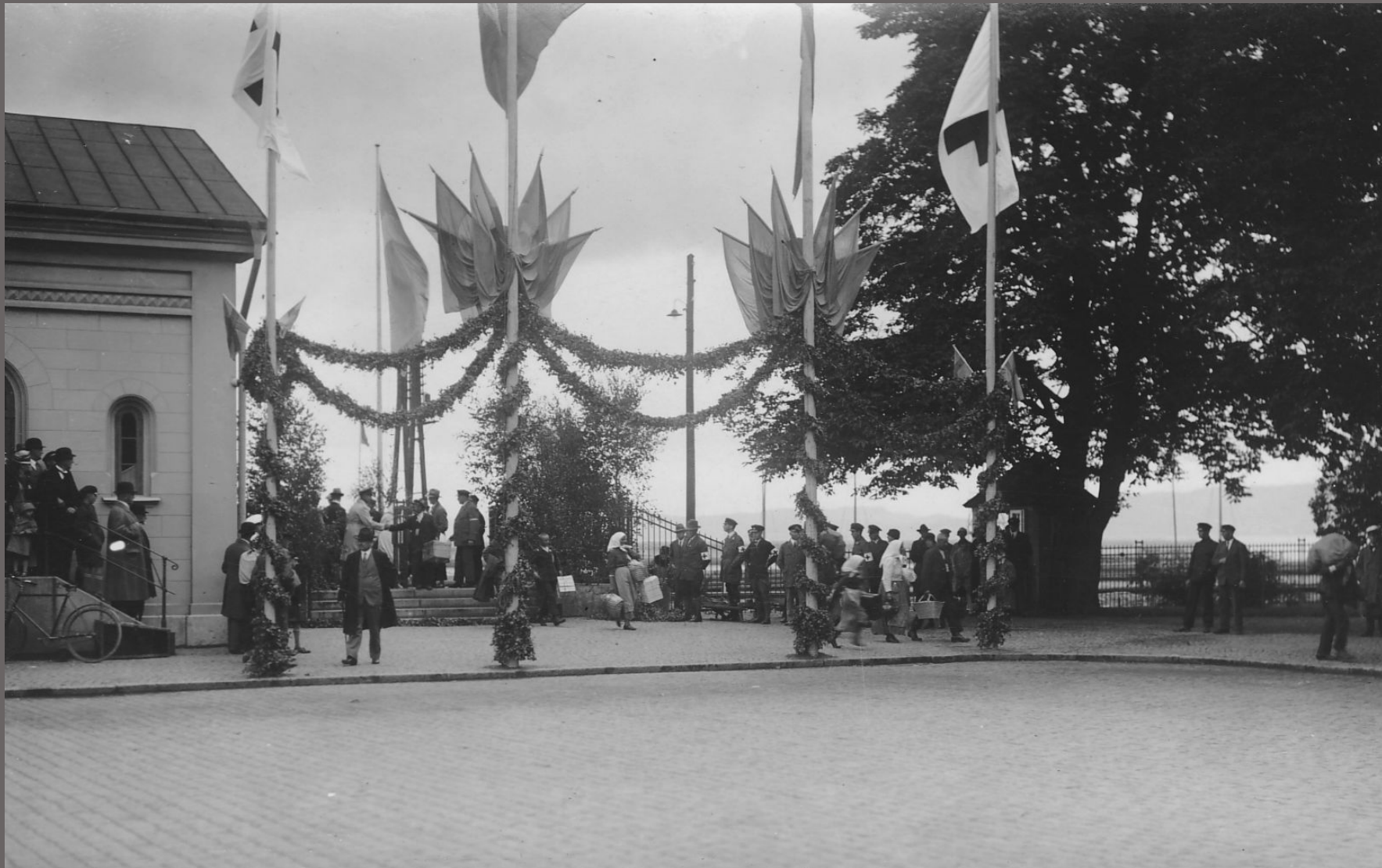
Den 2 augusti 1929 var Jönköpings järnvägsstation smyckad med flaggor och björk girlander för att välkomna Svenskbyborna.