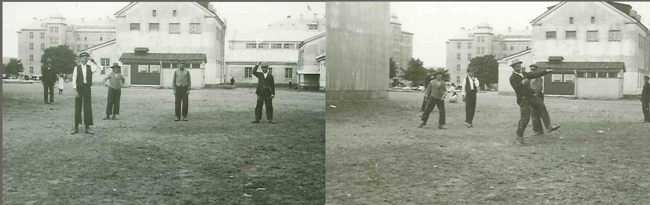
Här sysselsätter unga och gamla sig med hörnleken, en bollek med poängberäkning