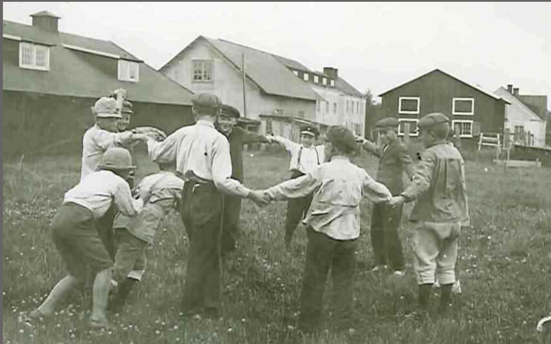
Här leker man katt och råtta. Katten har just fångat råttan