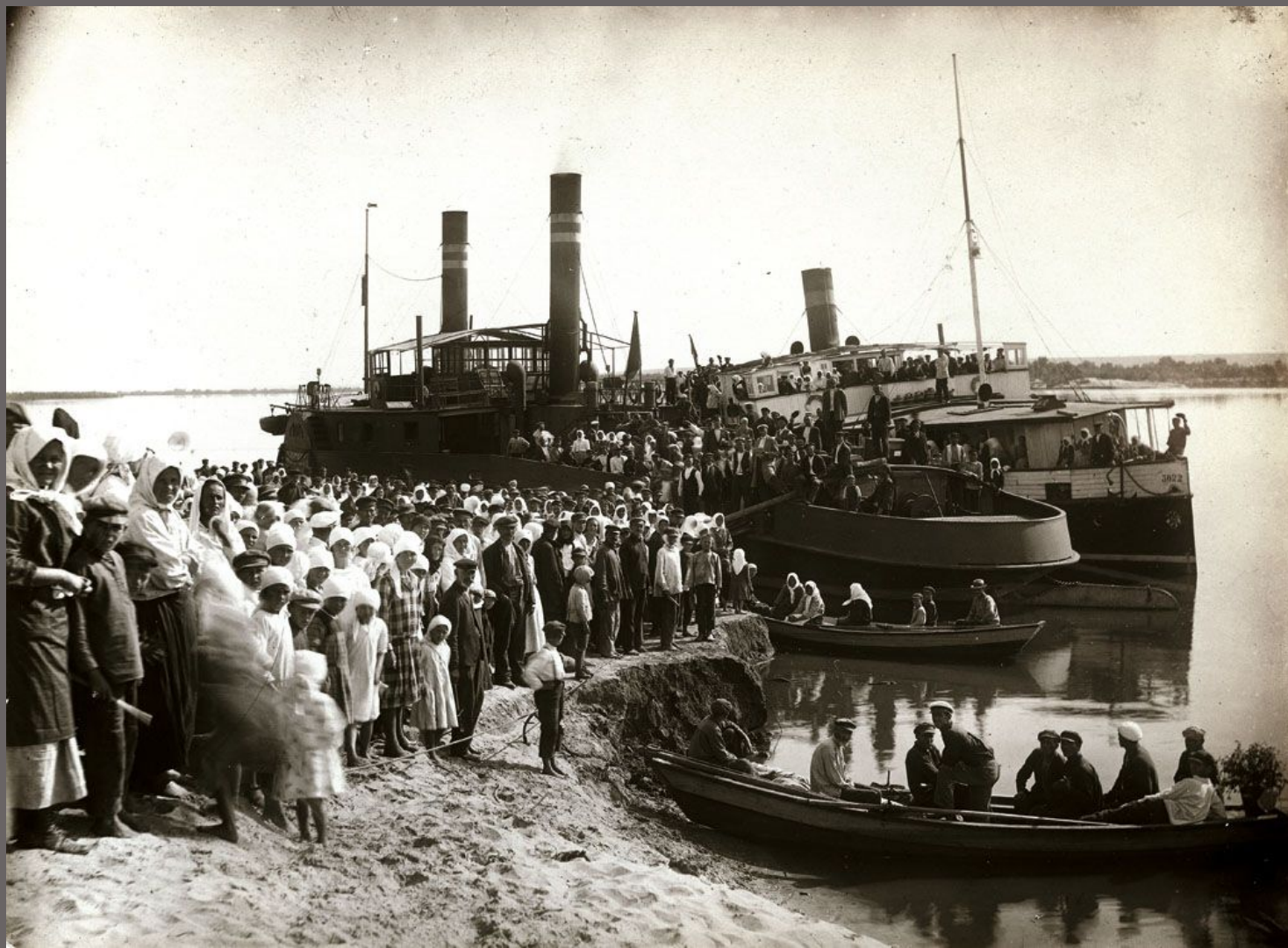
Avfärden från Gammelsvenskby den 22 juli 1929. Byborna står redo på Dnjeprs strand för ombordstigning på flodångarna "25 oktober" och "Vorochilov" som tar dem ner till Svarta Havet.