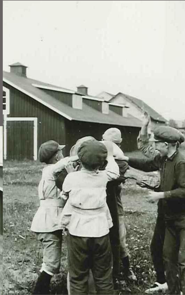
En lek som kallas "Bygga Kvarnen"