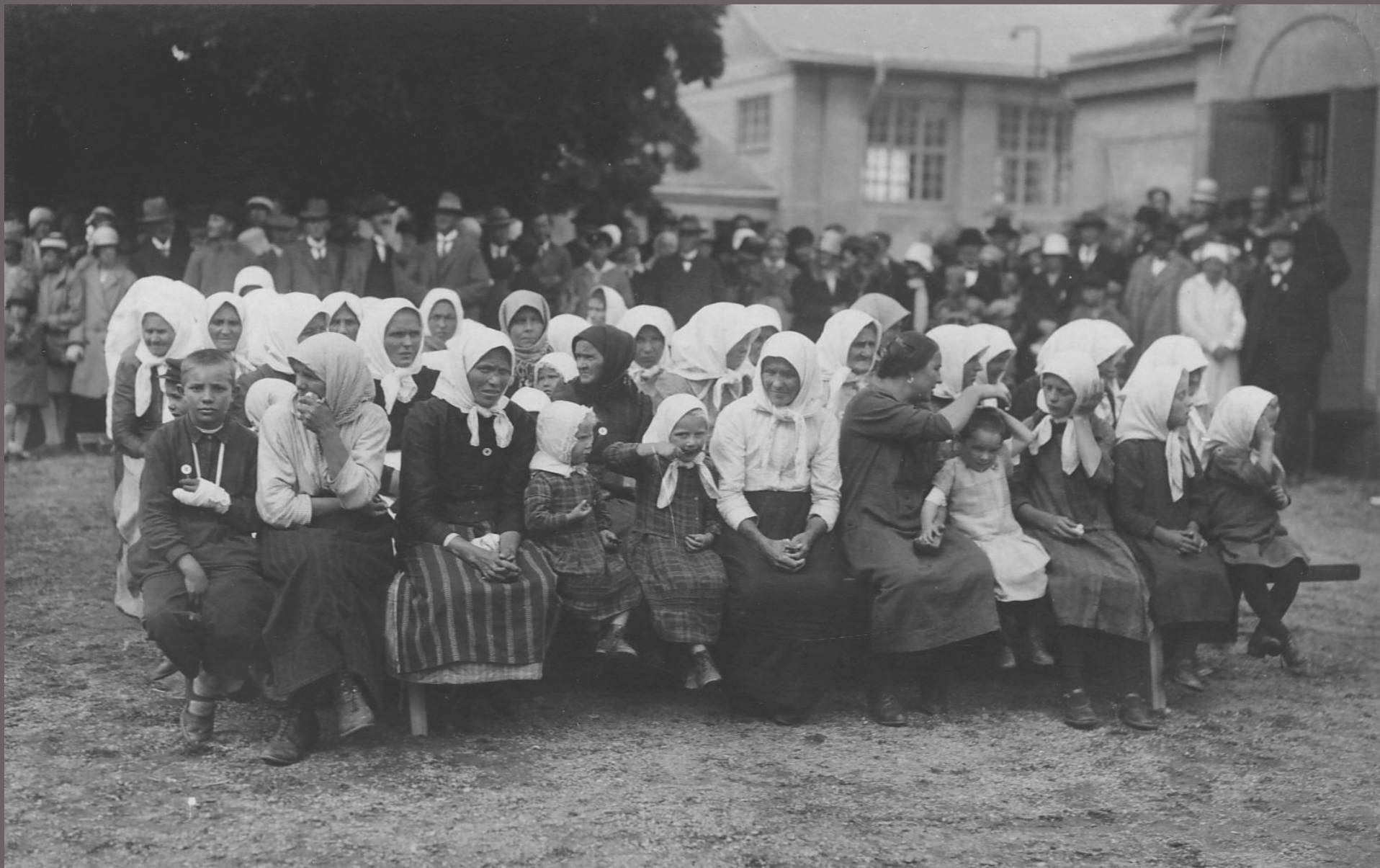
Trötta resenärer beskådas av nyfikna Jönköpingsbor