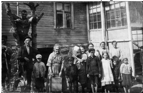
Hyresgäster framför stora huset Åsensvägen 70, Omkring 1920.