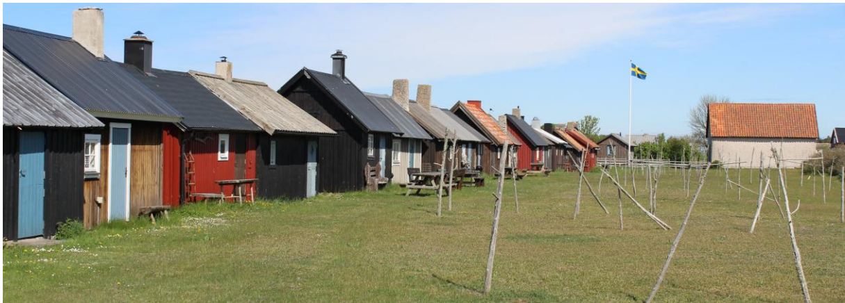
Gistgård vid Gnisvärd, Tofta.

Anslag ur Hembygdsförbundets hyllnings- och minnesfond har getts till Högbysskolan i Hemse för aktiviteter vid Stavgårds i Burs och till Stiftelsen Vike minnesgård för återställande av Skogshagen vid Vike i Gothem. Utöver det har fyra bidrag lämnats för tryckning, dels för böckerna Dansminnen Gotland och Hoburgen och Sundre. Gotlands dramatiska sydspets , dels för sockenböcker för Bara och Hejde.