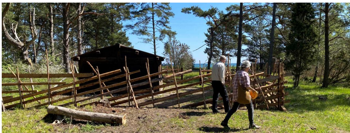
Nyrenoverad strandbod och tun vid Vike i Boge.

Vid årsstämman 2024 fick Sanda hembygdsförening ett diplom då den firat 100 år som hembygdsförening.