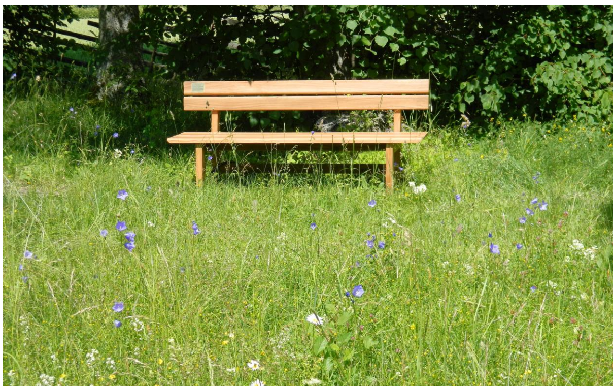
Minnesbänken i Alvena lindaräng, Vallstena.