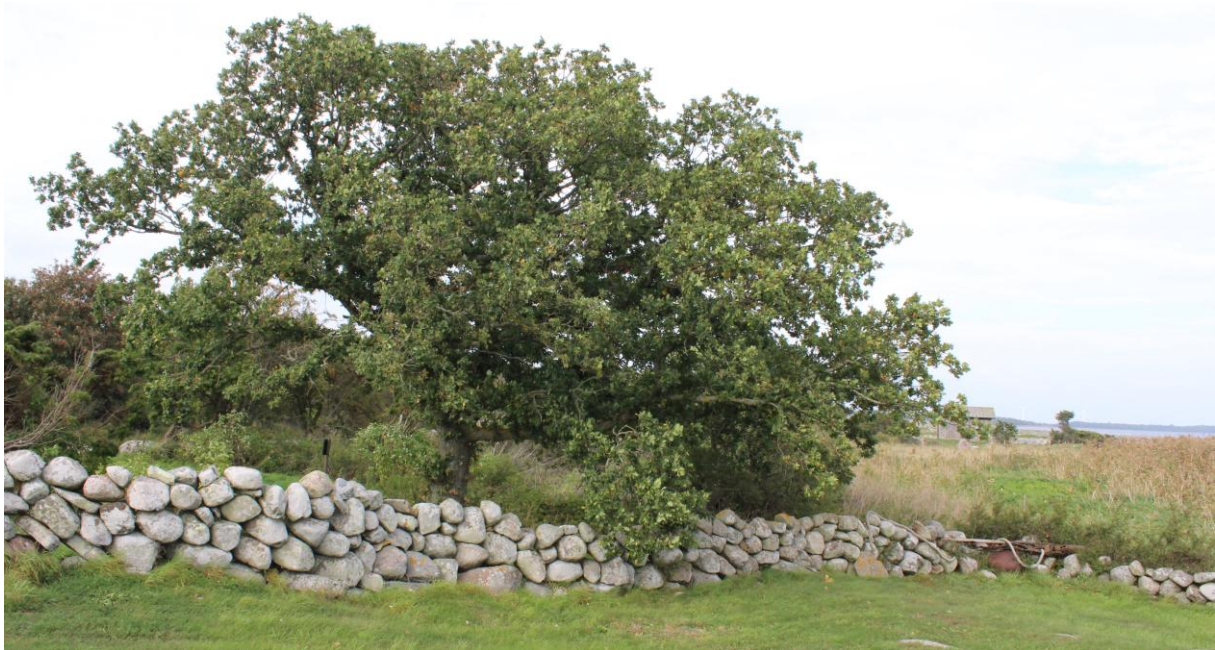
Fluntinge i Grötlingbo.

Gotlands hembygdsväsende äger den så kallade Sparrekonsten, vilken omfattar 495 tavlor. Konsten är deponerad hos Gotlands Museum och visas i olika sammanhang på ön.