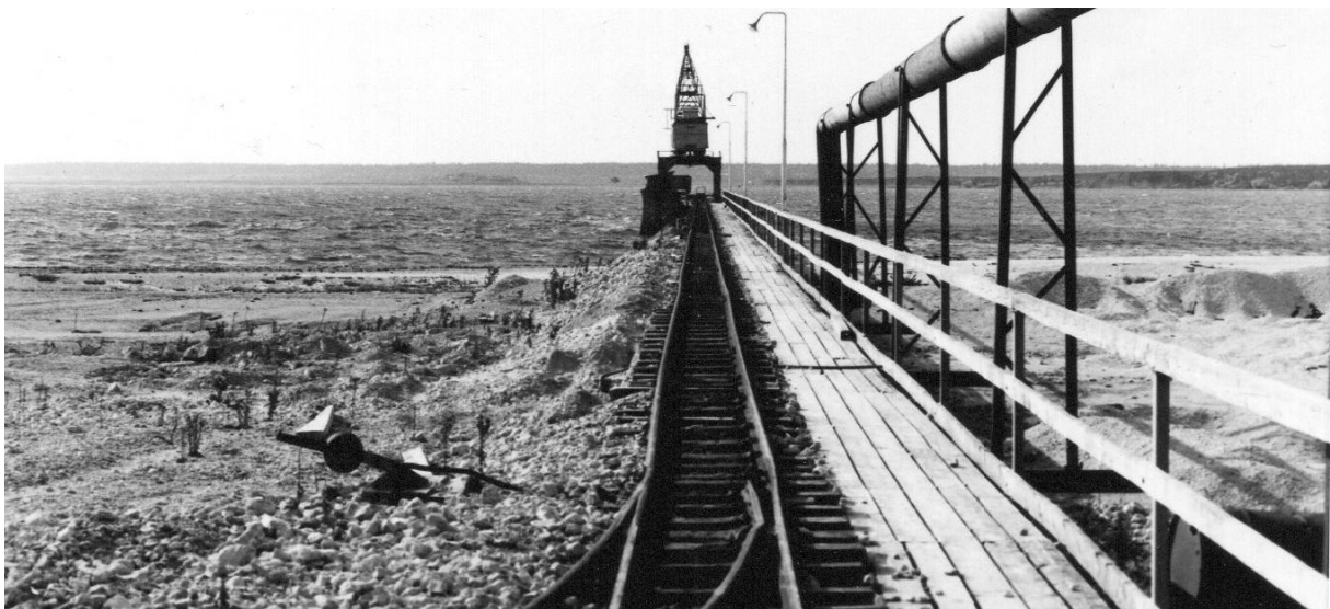
Utlastningshamnen på Furillen i Rute 1974.