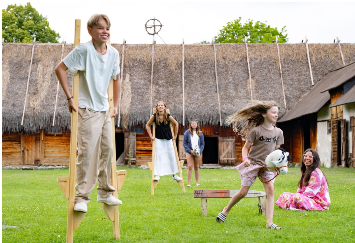
Lekar vid Vike minnesgård i Boge.