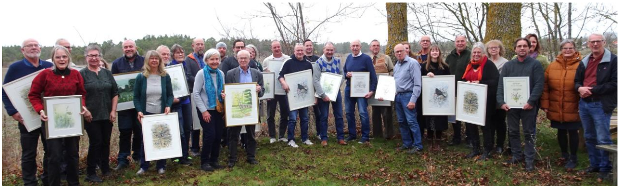
Deltagare från årets belönade ängen vid ängsdagen i Hangvar den 9 november 2024.

Förbundets ängskommitté stödjer ängshävdare och sprider kunskap om god ängshävd på Gotland. En viktig uppgift är att regelbundet besöka Gotlands alla ängen och se över och diskutera skötsel. Ängskommittén bevakar frågor gällande miljöersättningar och annan aktuell information och förmedlar detta.