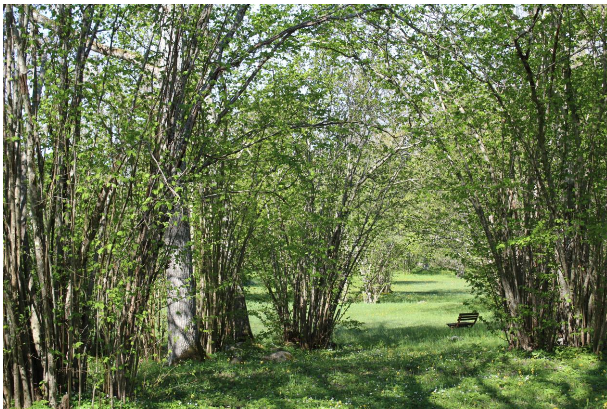
Mästerby änge.

Förbundets avsikt är att också de övriga två kvarnarna ska renoveras och arbetet med den södra kvarnen påbörjades i slutet av 2024. Ansökningar om stöd för renoveringen har gjorts hos Konung Gustaf VI Adolfs fond för svensk kultur och Wilhelmina von Hallwyls Gotlandsfond samt hos Länsstyrelsen - stöd för kulturhistoriska miljöer.