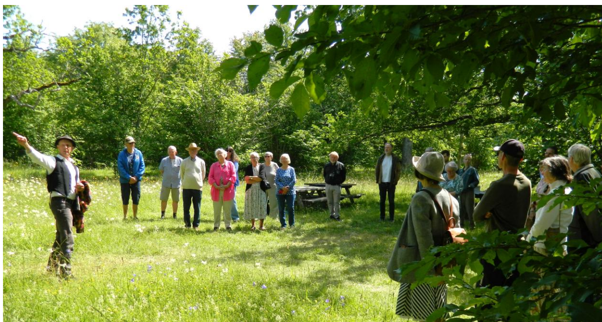
Ängsdag i Alvena lindaräng den 15 juni 2024.

16 januari 2025, Gotländska Ängskommittén