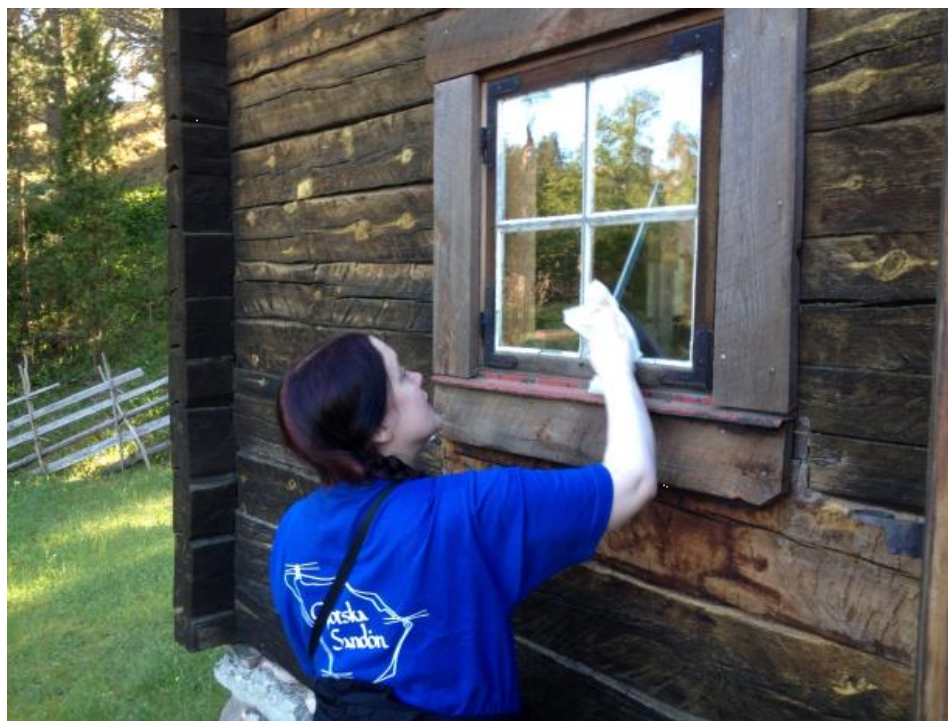
Madam Söderlunds stuga, Gotska Sandön.

Styrelsen har under året haft sju protokollförda sammanträden. Utöver detta har ledamöterna haft möten i olika arbetsgrupper, vid sidan om representation i stiftelser och föreningar.