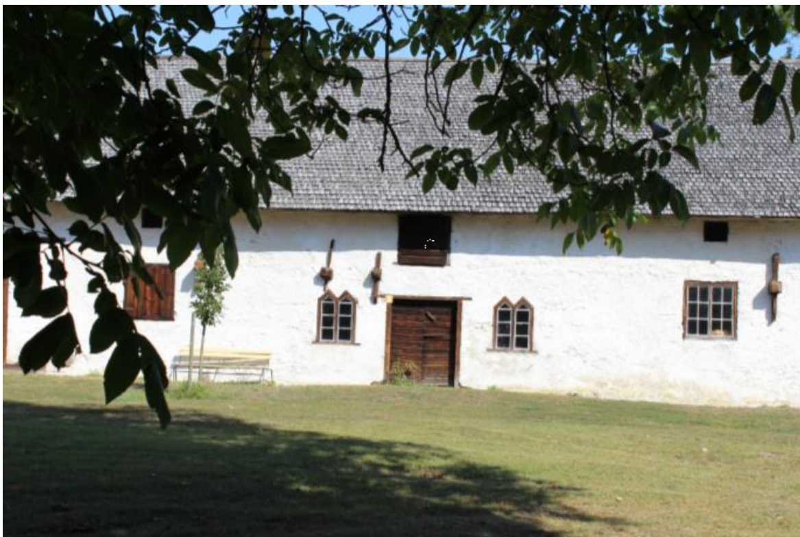
Burs prästgårdsladugård