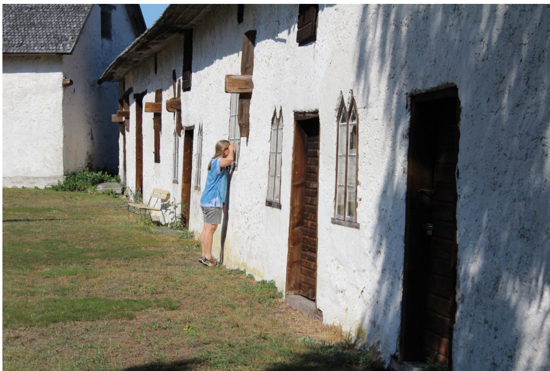
Nyffiken på kulturarvet.