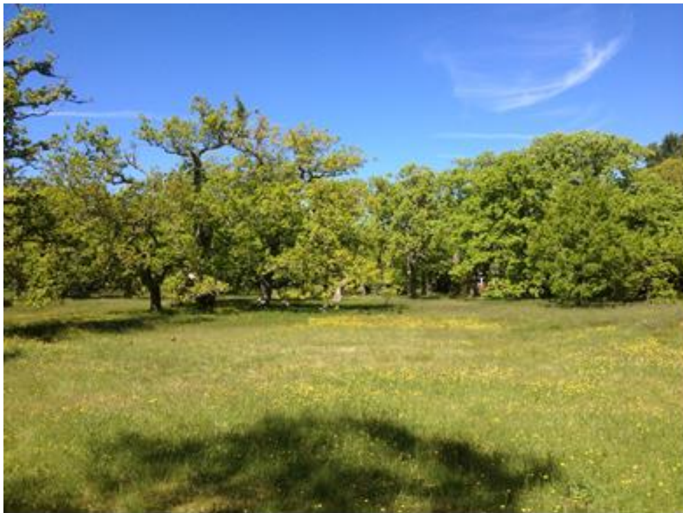
Kapellänget, Gotska Sandön.