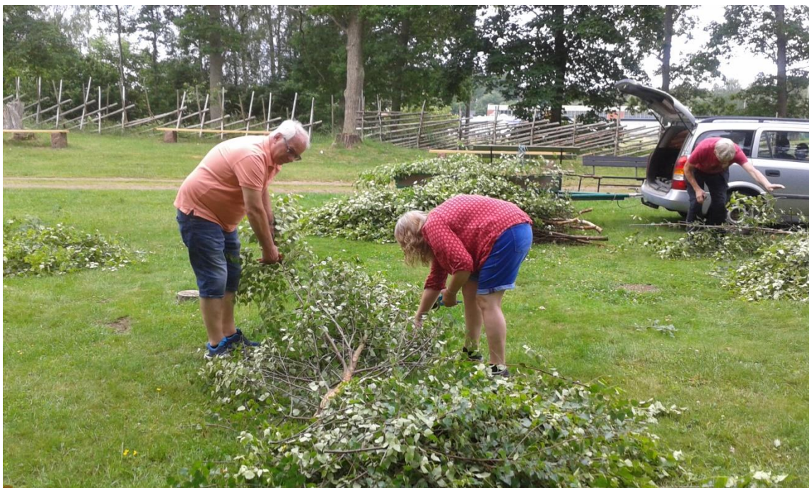
Klädsel av midsommarstången juni 2019