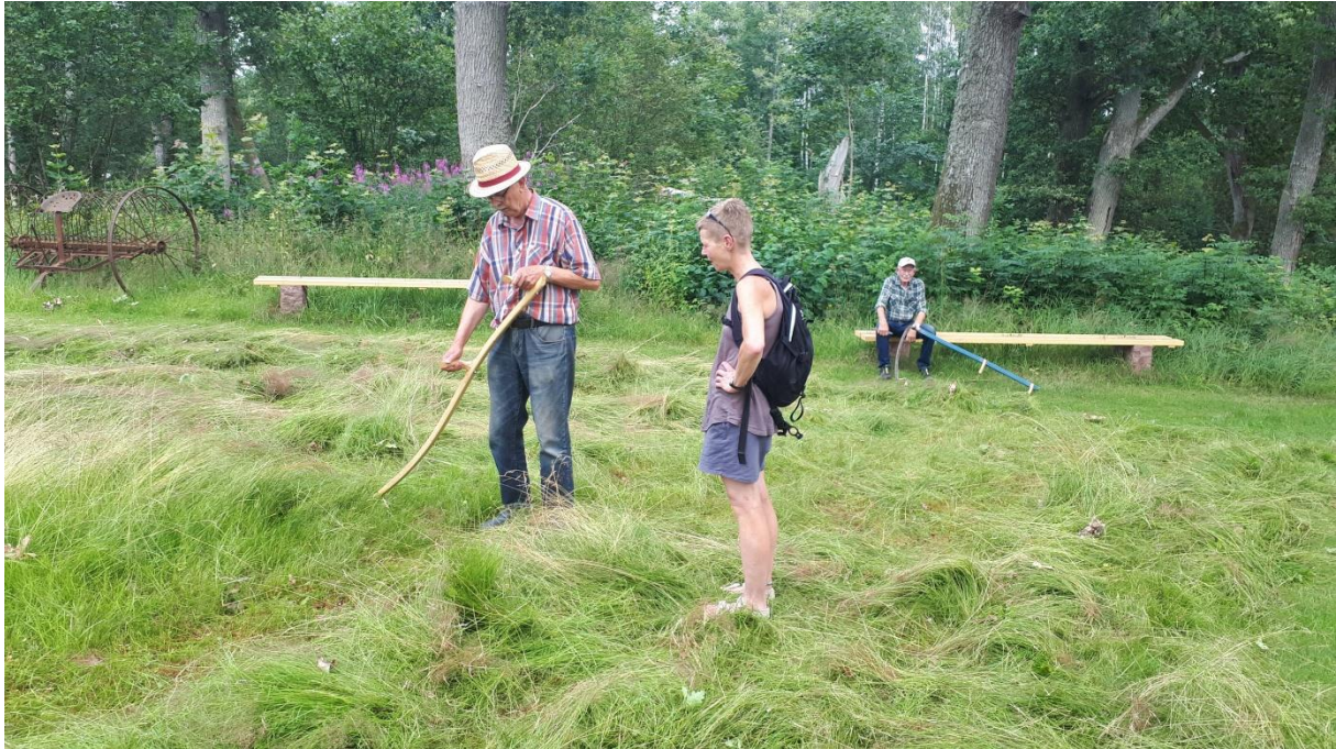
Slätter i Broby hembygdspark den 24 juli 2019.

Under sommaren kommer hembygdmuseet att vara öppet varje söndag kl. 13-16 under tiden 14 juni - 16 augusti. Museet är dessutom öppet första onsdagen i varje månad kl. 13-16.