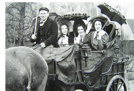
Postdiligensen på utflykt 1967

Den enda av museets byggnader som är hitflyttad. Här finns en samling vagnar och diligenser, brandspruta, olika jordbruksredskap, slädar och plogar. I utställningen finns postdiligensen, en av två bevarade i landet, som trafikerade sträckan Åby-(nuv. Klippan) Höör fram till 1898, då Billinge fick järnväg.