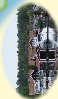
Hamnen i Björnsund