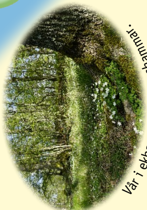
Vår i ekhage nära Bergshammar