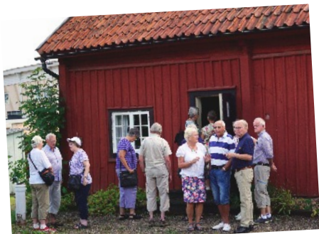
Fogdöns äldsta skola

Förfrågningar om guidningar: 0152-801 50 070-254 75 48