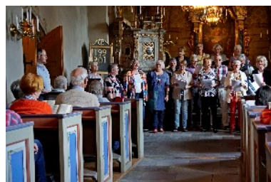
Konsert med Liljankören i Helgarö kyrka.