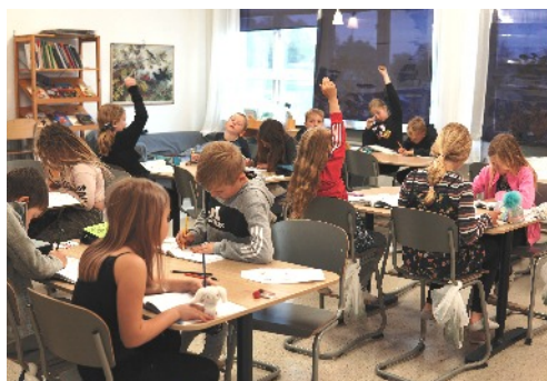
Ordning och reda i klassrummet med koncentrerade elever.