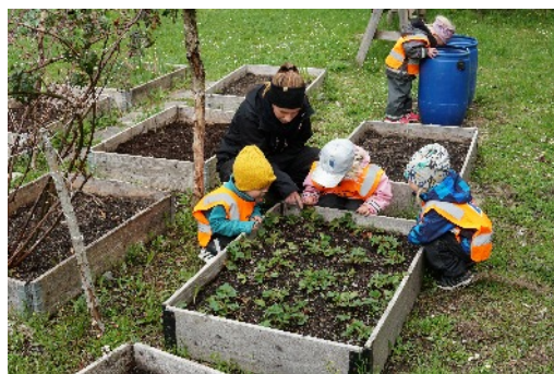
Nyfikna förskolebarn har koll på odlingarna.