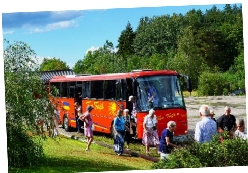
Större sällskap välkomna