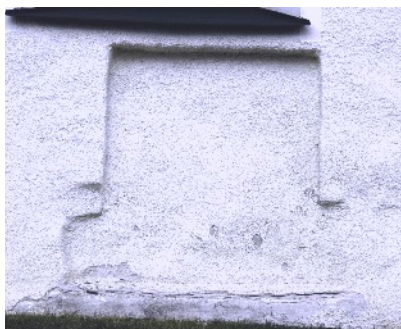
Den så kallade "nunneporten" på kyrkans södra sida är en sedan länge igenmurad entré. Kanske var det den som var nunnornas egen ingång, eller en processionsport - vi vet inte säkert.

Den år 2016 genomförda georadarundersökningen visar på kyrkans södra sida några intressanta strukturer under markytan som kan vara rester av byggnader. För att få ökad klarhet krävs arkeologisk utgrävning.