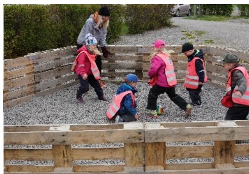
Rörelse och lek är en viktig del av skoldagen.

Visste du att föreningar och enskilda kan hyra friskolans sporthall.