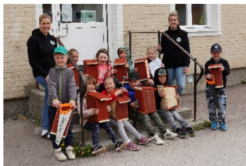
Att göra fågelholkar innebär både matte och hantverk.