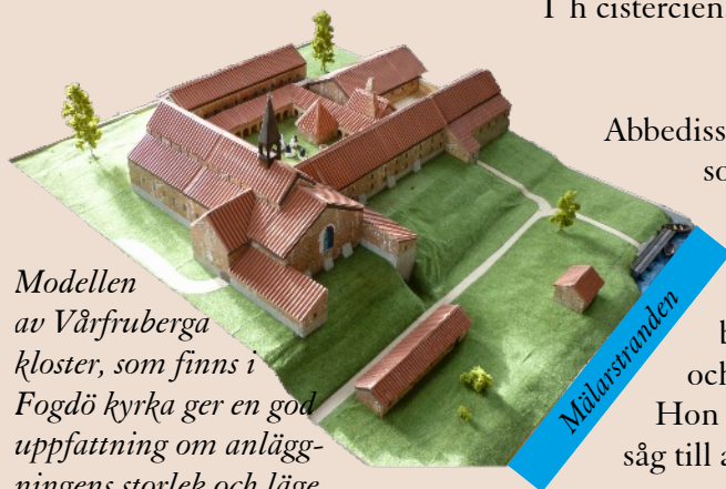
Modellen av Vårfruberga kloster, som finns i Fogdö kyrka ger en god uppfattning om anläggningens storlek och läge.

Abbedissan var den enda i klostret som hade kontakt med omvärlden. Hon skötte klostrets affärer och egendomsförvaltning och behövde till exempel avtala om köp och byten av mark och gårdar, klostrets "VD". Hon hade också ansvar för andliga frågor och såg till att nunnorna levde enligt klosterreglerna.