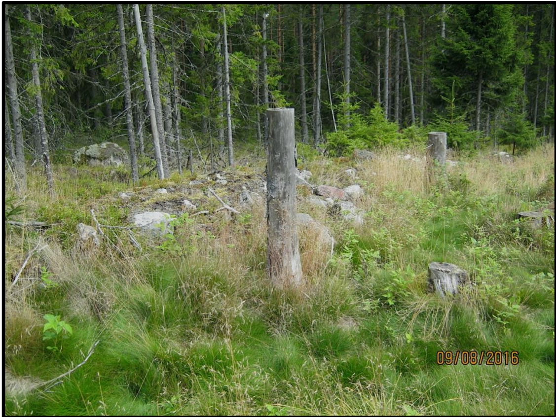
Odlingsrösen och stenvurar.