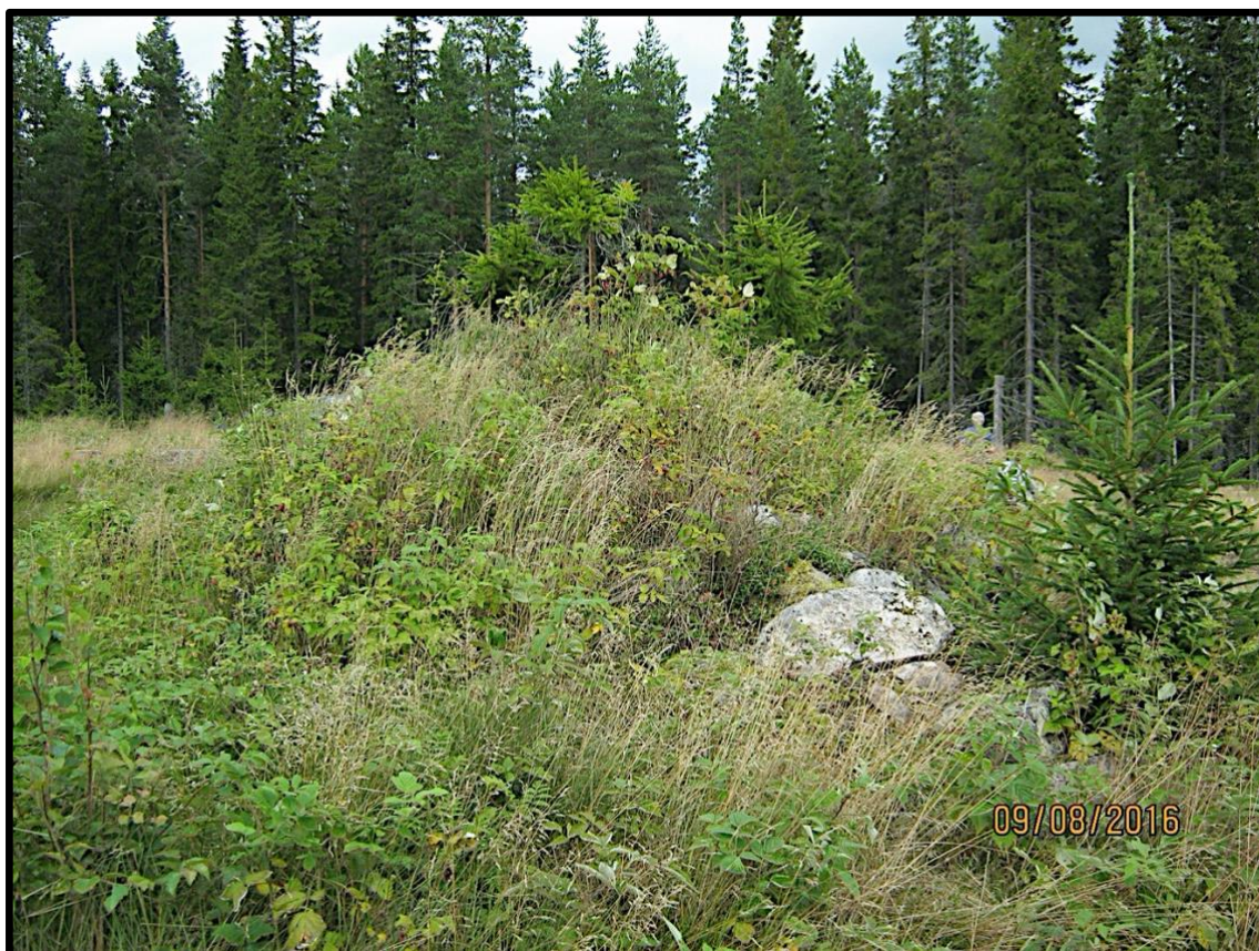
Lämning efter jordkällaren.