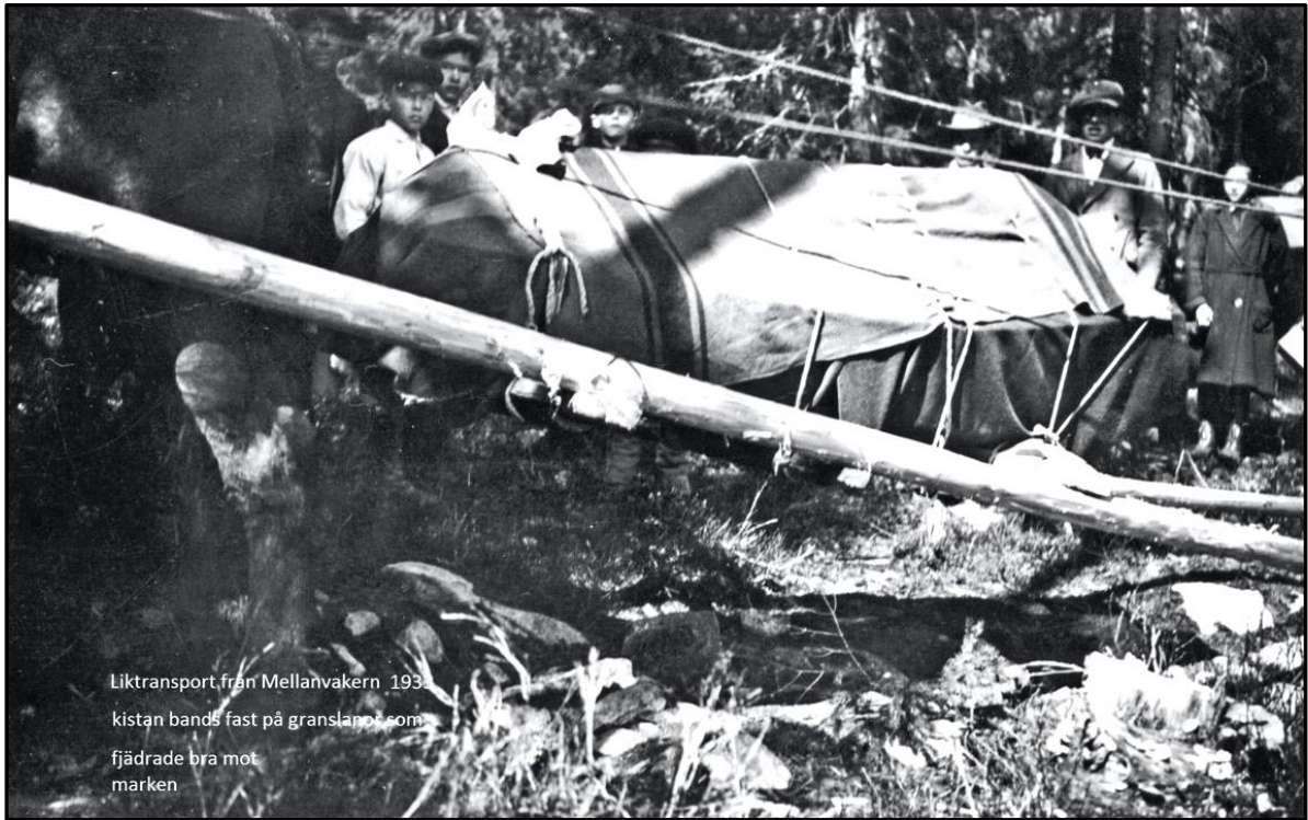
Liktransport från Mellanvakern 1933. kistan bands fast på granslapp som fjädrade bra mot marken