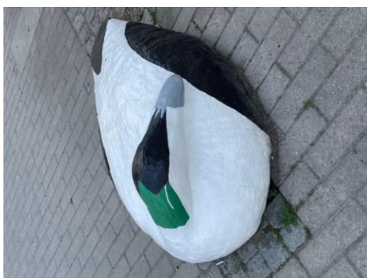
5 Här ligger jag och myser...men var?