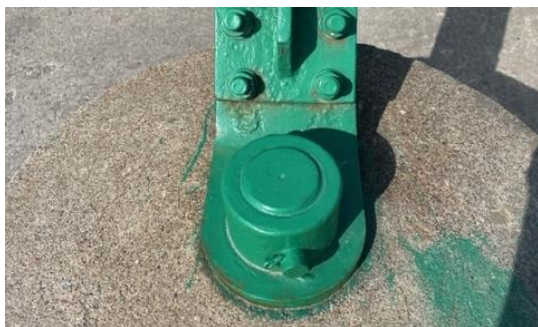
3 Stor skruv fixar höga vikter?