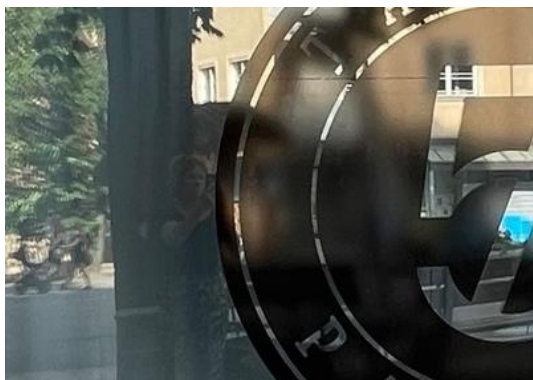
4 Blyertspenna funkar inte här...