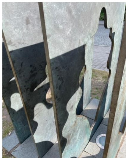
8 Ser du dubbelt? Ja, det finns faktiskt två. Vardå?