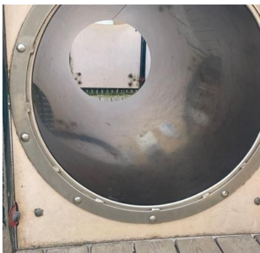
6 Här passerar nog mest skostorlek 25-30 ...