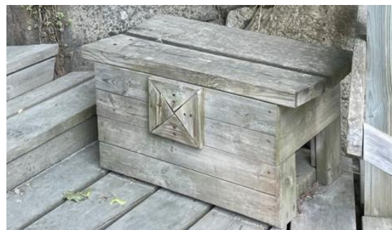
10 Vila gärna på väg upp eller ner. Var då?