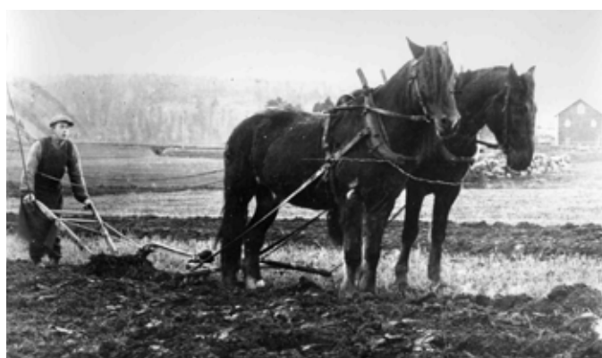
Oskar Pettersson plöjer groppgårdsgärdet 1914