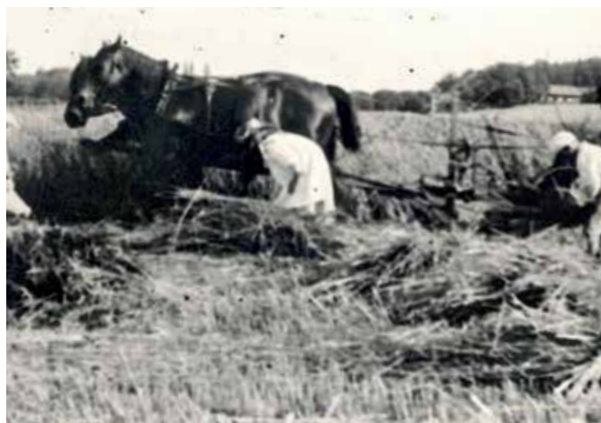
Såden skäres på Horn, sjögärdet 1905