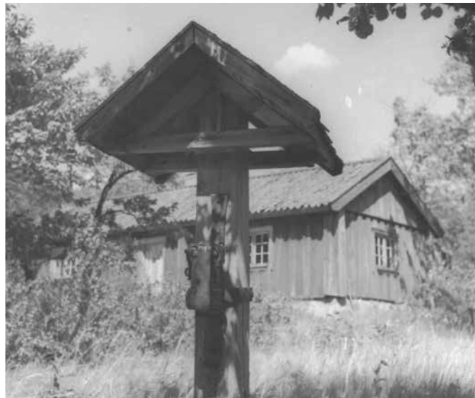
Krogstugan med fattigbössan

till hembygds museet och en replik sattes upp på samma plats. Krogen upphörde omkring 1860. År 1888 dog en kronojägare på Ridön. Han hade haft krogrörelsen vid sidan om av sitt ordinarie arbete i yngre dar.