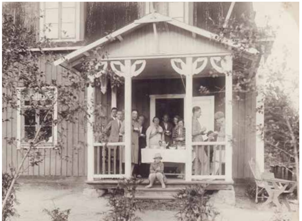
Pensionatsgäster på Granlunden

Fotot är taget i början av 1930-talet vid pensionat Granlunden i Överenhörna. Man ser gäster som samlats runt eftermiddagens kaffebord på den lilla uteverandan. Notera den vackra snickarglädjen. Kaffepetter står mitt på bordet och gästerna håller sina kaffekoppar i händerna. Flickan på trappan äter på en bulle. I bildens högerkant syns ett antal bikupor. Man ser också att björkar har satts upp på bägge sidor av gången ut till trädgården, är det kanske midsommar?