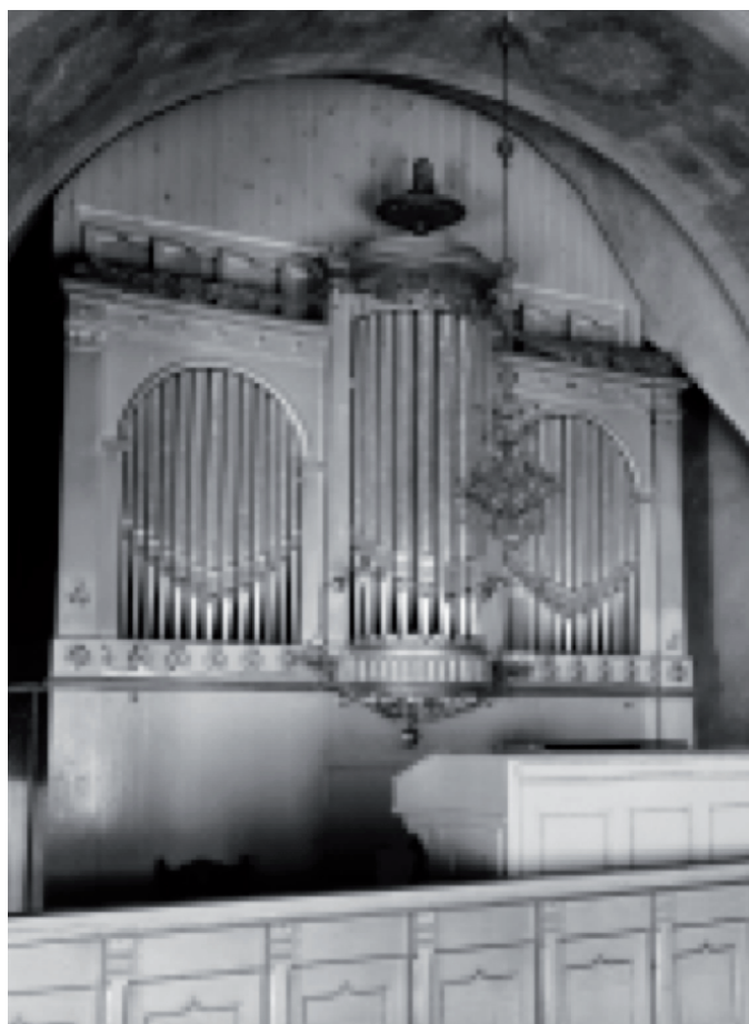
Orgelfasaden i Ytterenhörna Kyrka 1852.