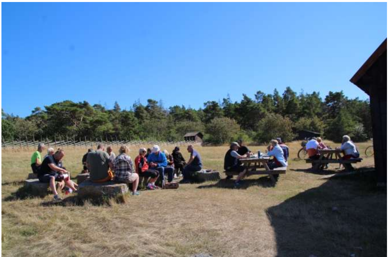
Tredje och sista stopp vid Kronvall: kaffekorgarna plockas fram