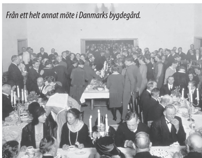
Från ett helt annat möte i Danmarks bygdegård.

DHF:s årsmöte planeras att äga rum i Sävja kyrka klockan 14.00. Kallelse till alla medlemmar utgår senast i januari 2023. Välkommen!