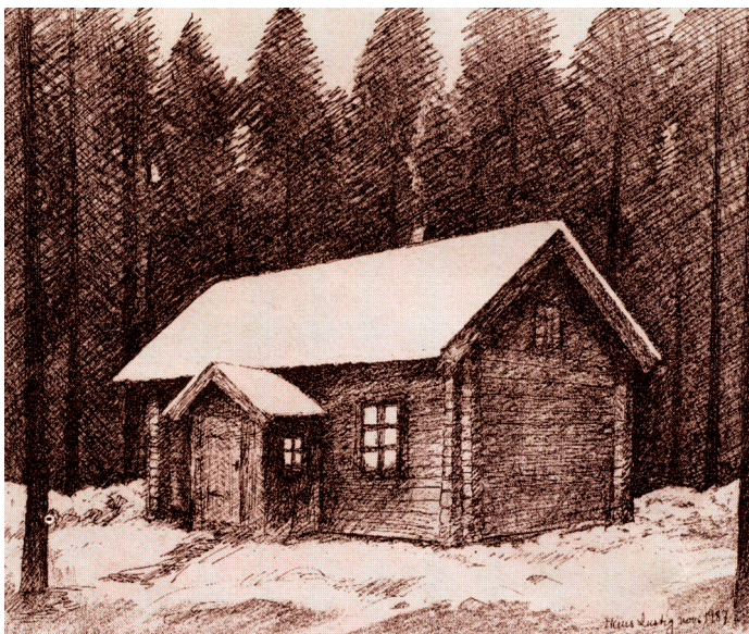
Lunsentorpet, laving av Hans Lustig 1987